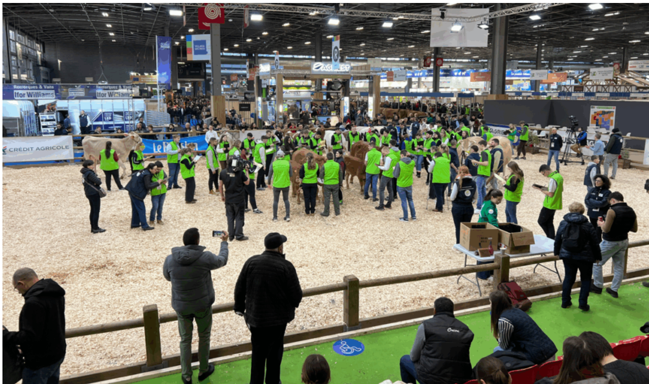
Concours européen de jugement des animaux par les jeunes (CJAJ) également appelé trophée du meilleur pointeur européen