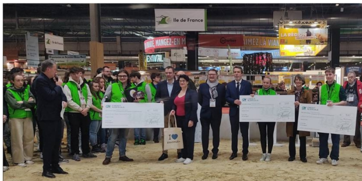
Remise des prix lauréats CJPV européens