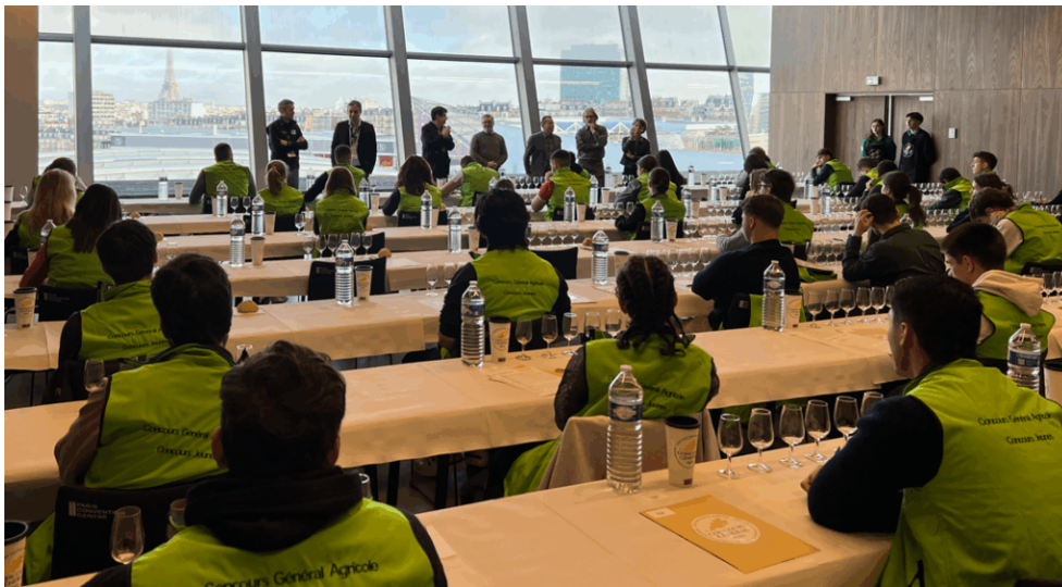
Présentation du jury CJPV

Le concours est ouvert majoritairement aux jeunes français mais un tiers des places accueillent des candidatures de jeunes européens sélectionnés dans le cadre d'une collaboration entre les réseaux français de l'enseignement agricole et leurs établissements partenaires du continent européen. Le palmarès est néanmoins scindé en deux : une section française d'une part et une section européenne d'autre part.