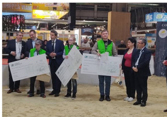
Remise des prix lauréats CJAJ européens

Parmi les 30 délégations européennes, trois lauréats de chaque concours sont primés à l'issue de cette journée d'épreuves et reçoivent des prix, en présence de tous les représentants professionnels et institutionnels en lien avec cet événement ; les jurys des concours, le commissaire général agricole et son équipe, les représentants du Ministère de l'agriculture et de la Souveraineté alimentaire (BRECI-DGER) ainsi que de l'Agence Erasmus + et des autres partenaires de ces concours.