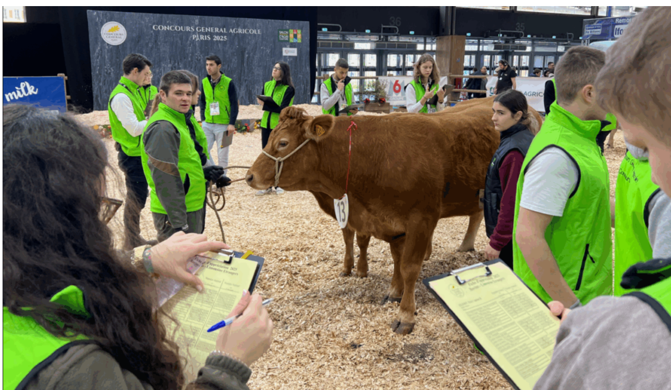
Candidats CJAJ européens en action