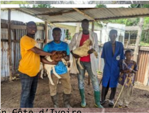
En Côte d'Ivoire Au Bénin

À pa rt ir de ce mo me nt - là , un e pr ép ar at io n sp éc if iq ue au x Ov in pi ad es a ét