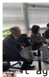
Photo de tête d'article, – Sagae, Province de YAMAGATA