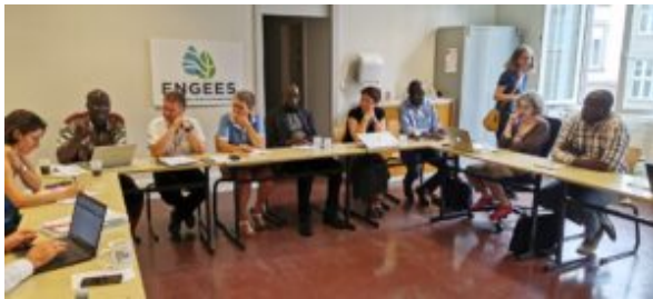
Séance de travail à l'ENGEEES, l'École National du Génie de l'Eau et de l'Environnement de Strasbourg