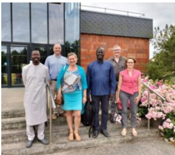
Visite d'ONIRIS, Ecole d'enseignement d'agronomie et vétérinaire à Nantes