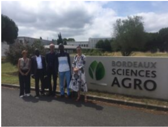
Accueil de la délégation à Bordeaux SciencesAgro