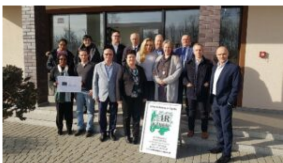
Ensemble des partenaires du projet Erasmus+ Agropuzzle

Dans le cadre d'un projet Erasmus+ partenariat de coopération, Agropuzzle , l'EPLEFPA de la Guyane a contribué à l'édition d'un livre présentant les plantes médicinales utilisées dans les pays partenaires du projet.