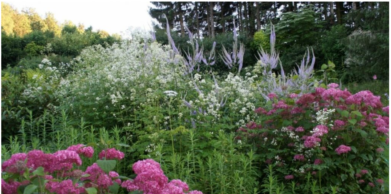
Jardin de Berchigranges en juillet

Heureusement l'enthousiasme de nos homologues berlinois ne s'est pas étiolé !