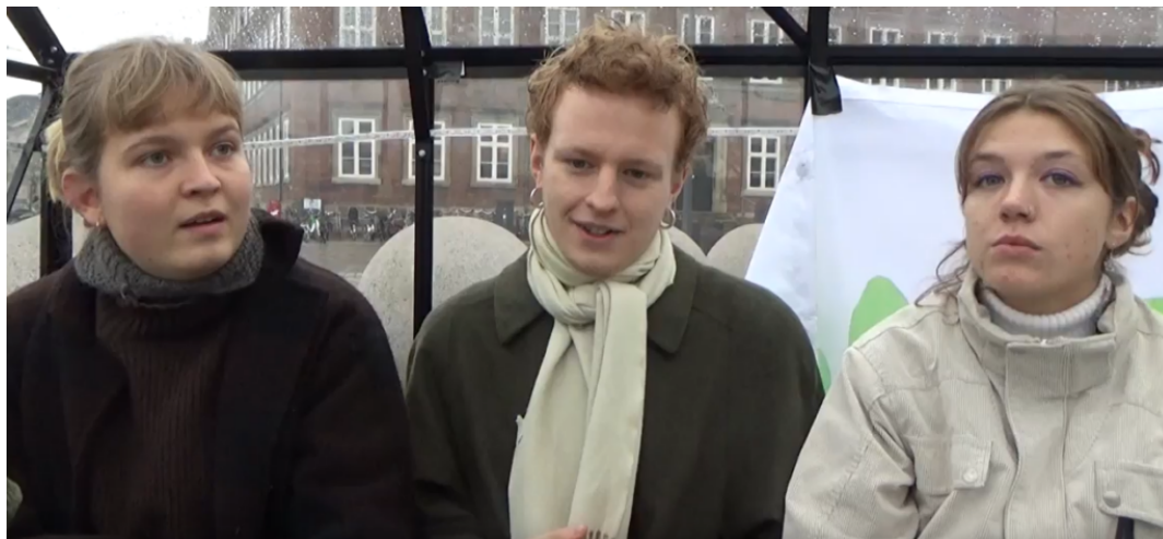
Interview de 3 jeunes des Green Movment à Copenhague__