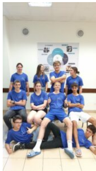
Les élèves d'Agricampus Laval devant leur affiche

travaillé le thème de l'économie circulaire en classe avec leurs enseignants, sur le contexte du lycée et de la Mayenne, pour pouvoir l'exposer aux différents participants lors de ce séjour, in English of course !