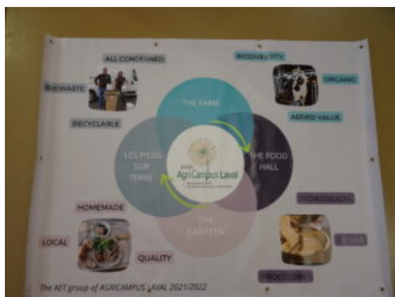
Une partie du travail des élèves d'AET

Ils ont par exemple présenté une vidéo sur le chemin du lait à Agricampus, une affiche en anglais sur l'économie circulaire, ainsi qu'un diaporama sur le passé et le présent... un séjour permettant de rendre très concret leur travail de l'année.