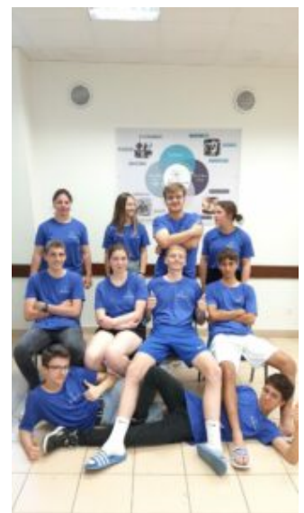
Les élèves d'Agri-campus

Il a regroupé à Sète 85 personnes, venant de divers pays européens, adultes et élèves de l'enseignement agricole. Parmi ces derniers, 10 élèves de Laval, en classe de Première Générale à Agricampus, ayant choisi l'option Agronomie Économie Territoire (AET). Toute l'année scolaire, ils ont travaillé le thème de l'économie circulaire en classe avec leurs enseignants, sur le contexte du lycée et de la Mayenne, pour pouvoir l'exposer aux différents participants lors de ce séjour, in English of course !