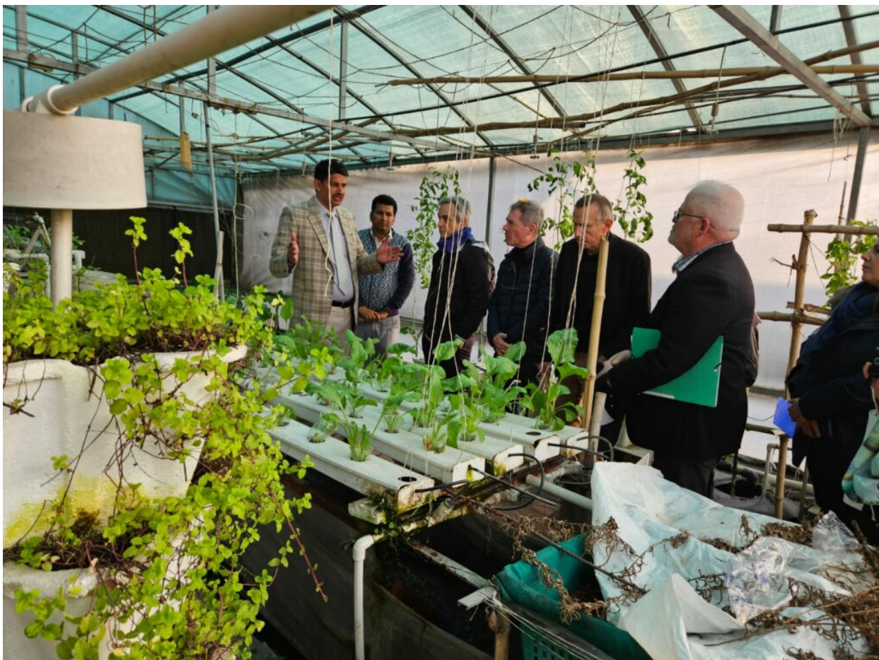
Serre expérimentale de cultures in-vitro