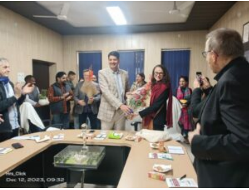
Accueil et mise à l'honneur de la délégation française