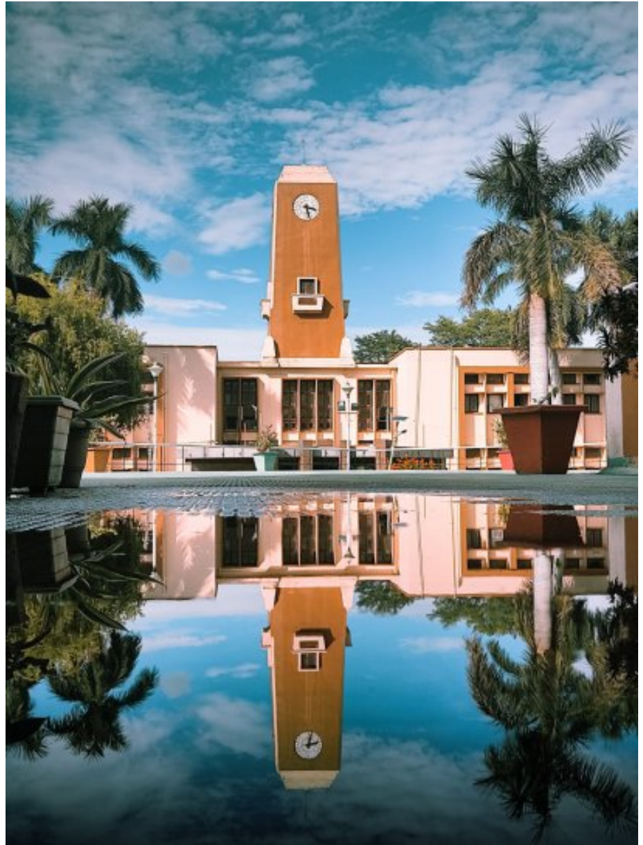
G.B Pant University of Agriculture & Technology of Pantnagar en Uttarakhand, au Nord de l'Inde