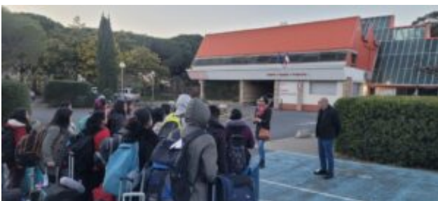
Arrivée à Théza

Depuis, chaque année, les animateurs du réseau Inde organisent l'accueil des étudiants indiens et leur stage dans une douzaine de lycées d'enseignement agricole en France. Après une semaine d'intégration au lycée de Théza à Perpignan, ils partent dans les établissements partenaires du programme DEFIAA – Developping French Indian Exchanges in Agroffod and Agronomy – et vivent l'aventure française.