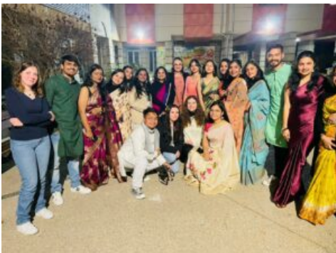
Soirée de Gala

Happy Holi ! C'est le 8 mars 2023 que la fête des couleurs aux multiples vertus a été célébrée à Théza. Chaque équinoxe de printemps, Holi , la fête des couleurs en Inde, entraîne le pays dans un tourbillon collectif et multicolore. Il s'agit de pardonner à ses ennemis et de manifester son amour à ses proches et amis. Les indiens croient également en l'action purifiante des couleurs au contact avec les pores de la peau.