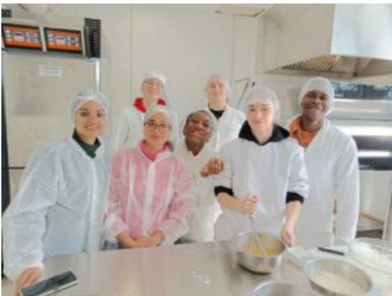
Au laboratoire de microbiologie et Chimie