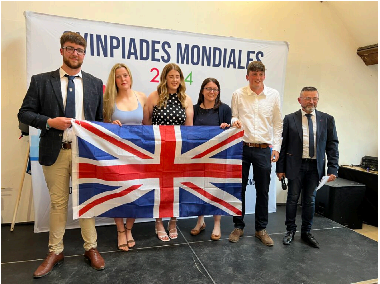
Candidats du Royaume-Uni