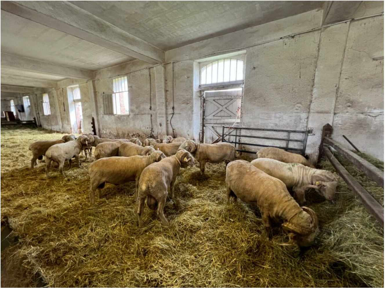
Bergerie Nationale de Rambouillet