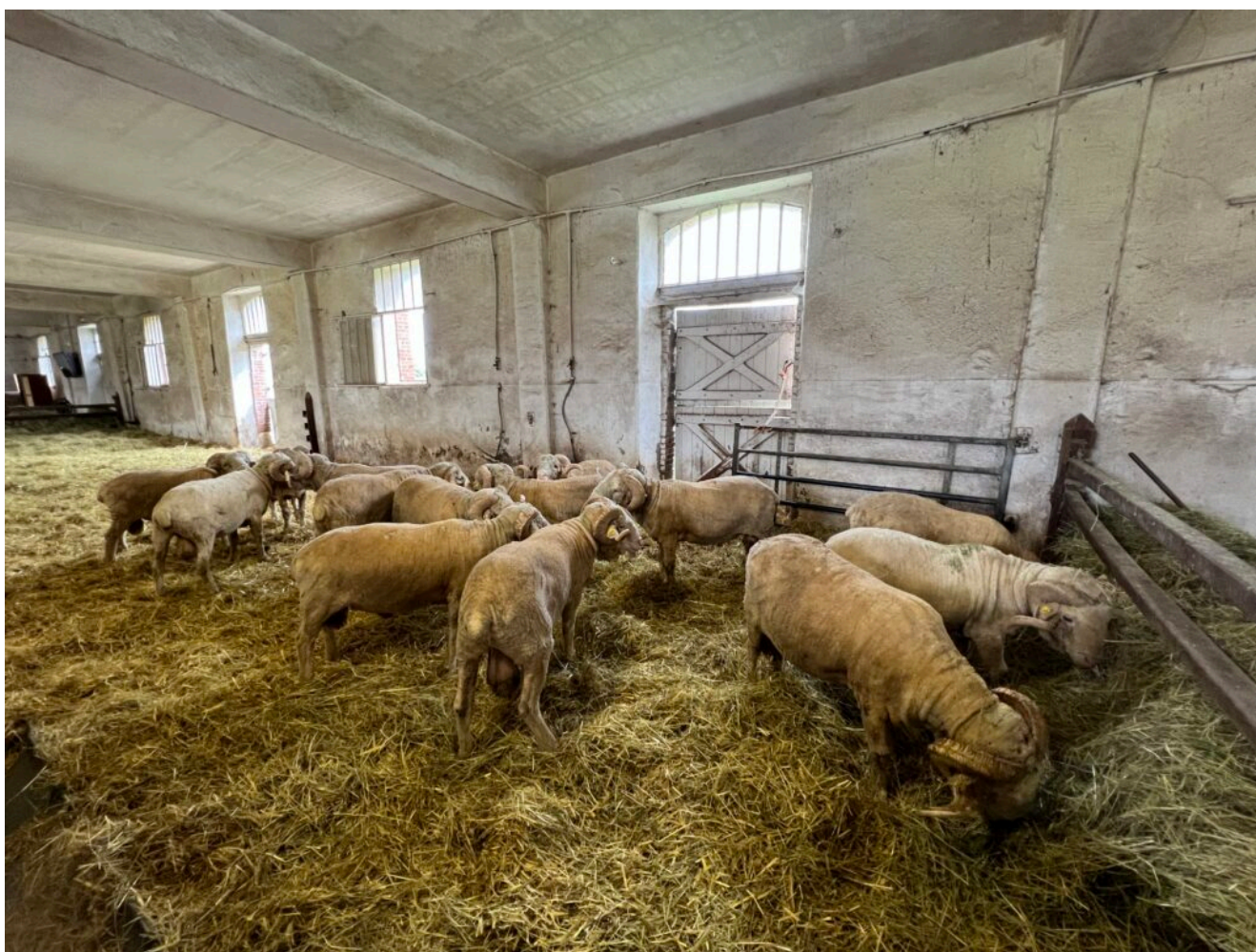
Bergerie Nationale de Rambouillet