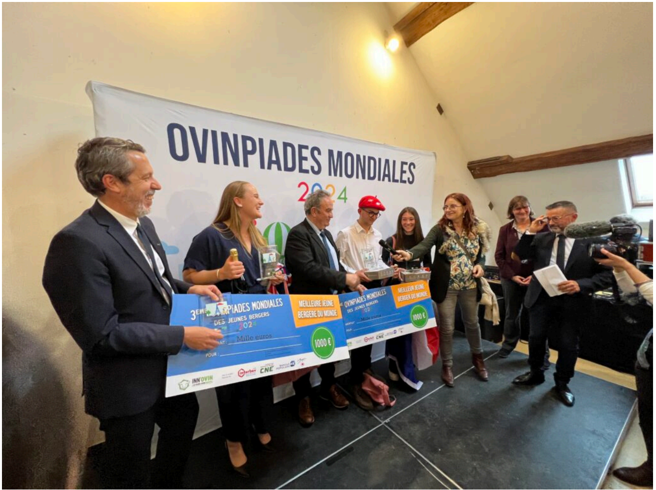
Remise des Prix