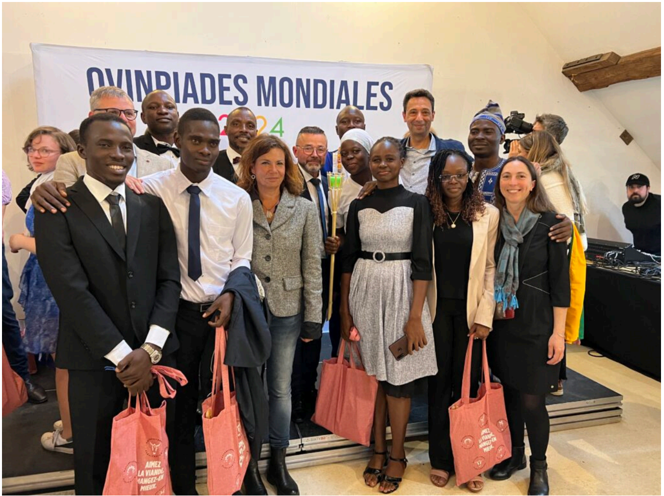
Délégations de l'Afrique de l'Ouest