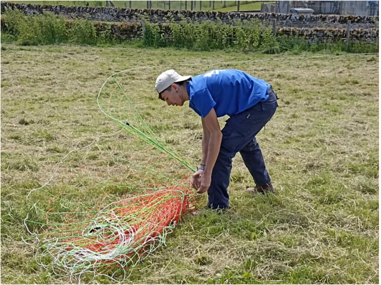
Épreuve de pose de clôture