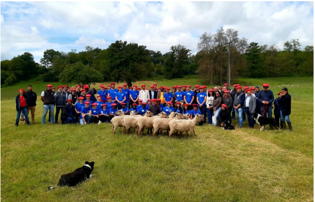
Ovinpiades mondiales 2024