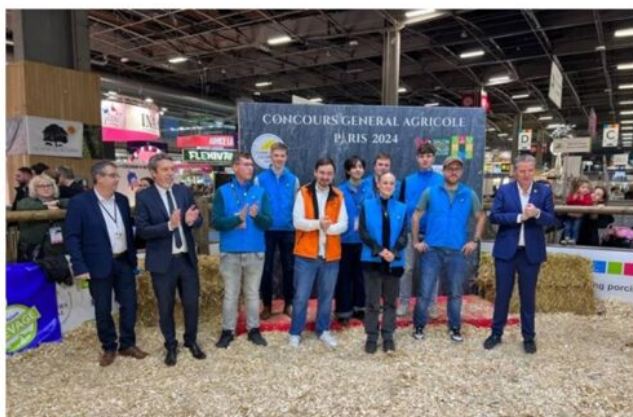
Remise des prix - lauréats CJPV/CJAJ européen