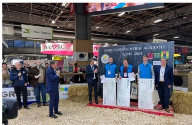
Remise des prix - lauréats CJAJ européen