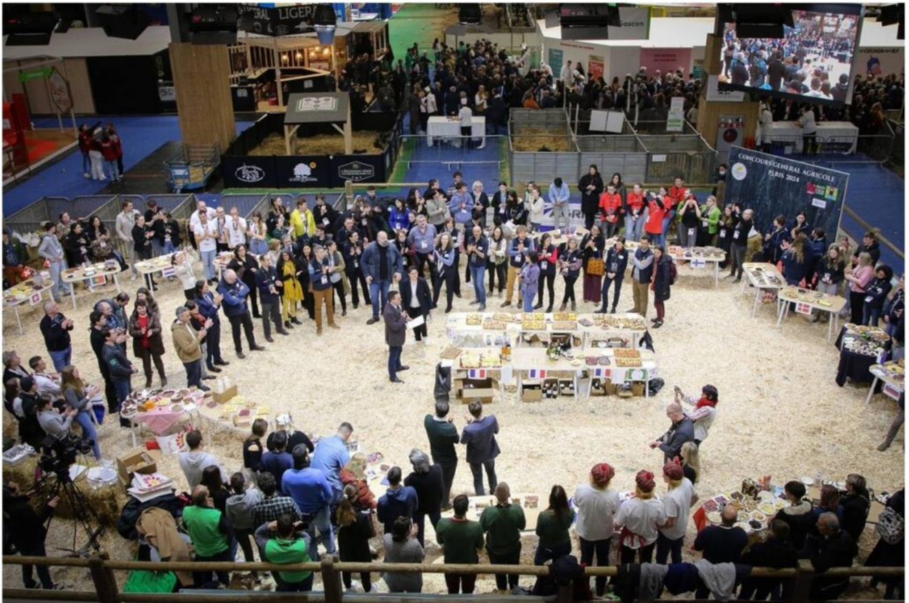
Aerial view of the « European evening » in the pig ring (pavilion 1, SIA)