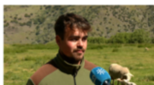
Dos pastores Andaluces en las Ovinpiadas Internacionales 2024