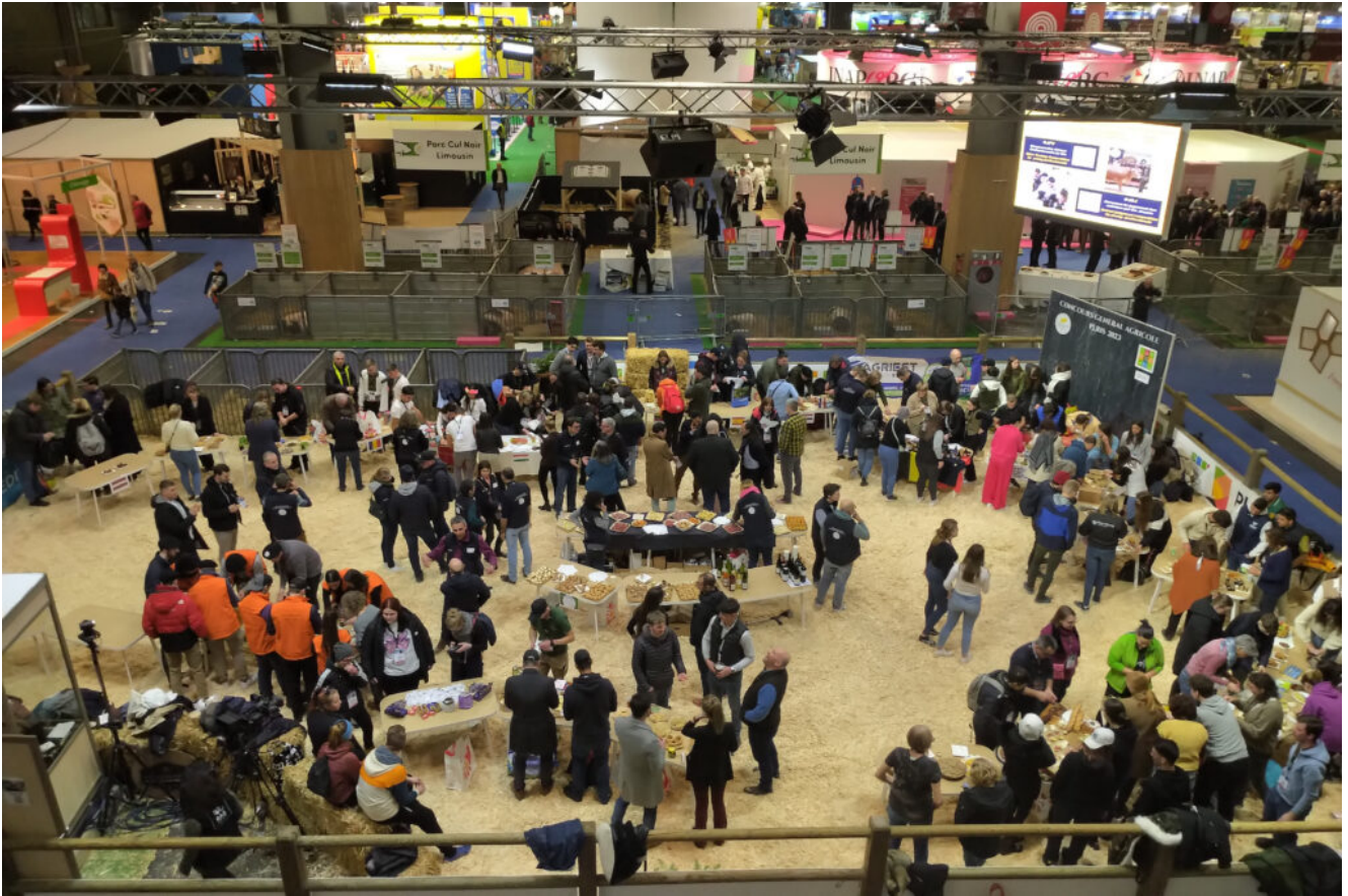
Soirée européenne sur le Ring Porcin