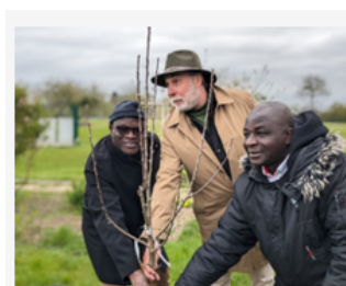
Deux semaines franco-ivoiriennes

agricoles, au sein des réseaux de l'enseignement agricole ou dans les écoles d'ingénieurs, vétérinaires et du paysage ainsi que dans les pays partenaires, des informations relayées par les correspondants dans les structures à l'international, et ce, depuis fin 2018, date du lancement du site PortailCoop.