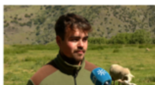
Dos pastores Andaluces en las Ovinpiadas Internacionales 2024