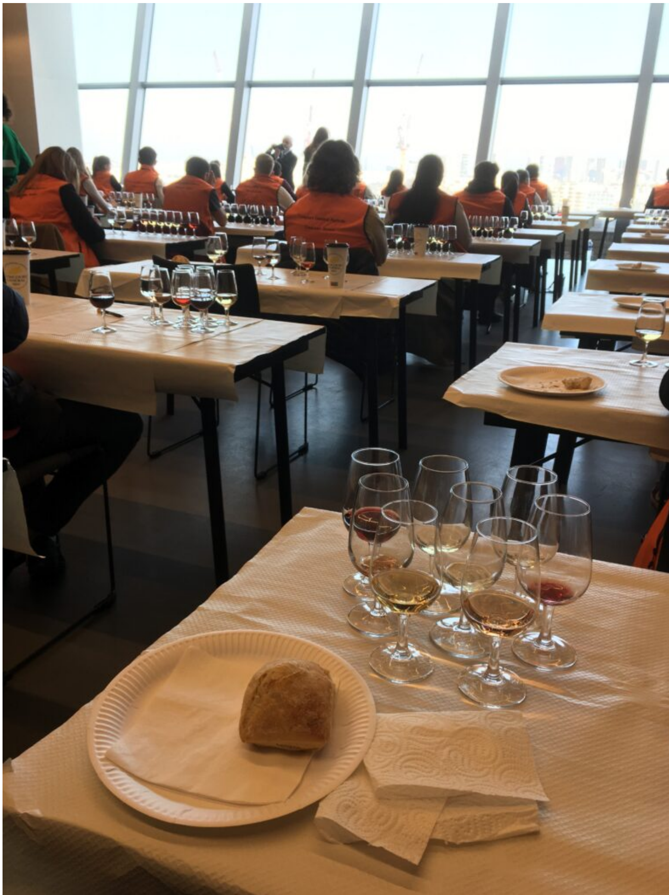
Condition de concours CJPV