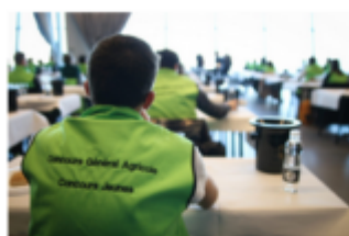
Young Europeans, get ready for SIA 2025