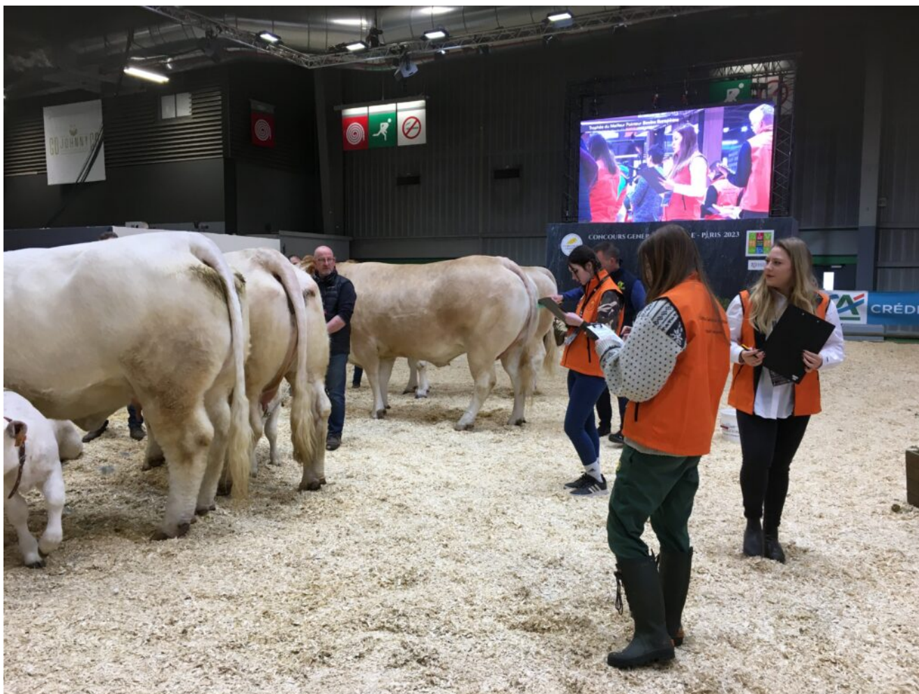
Epreuve de pointage sur le Ring – CJAJ