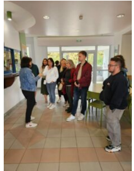
Visite du lycée de Vic en Bigorre

Lors de leur passage à Vic-en-Bigorre, les étudiants tchèques ont animé une présentation en anglais auprès des élèves de Première STAV – Sciences et Technologies de l’Agriculture et du Vivant.