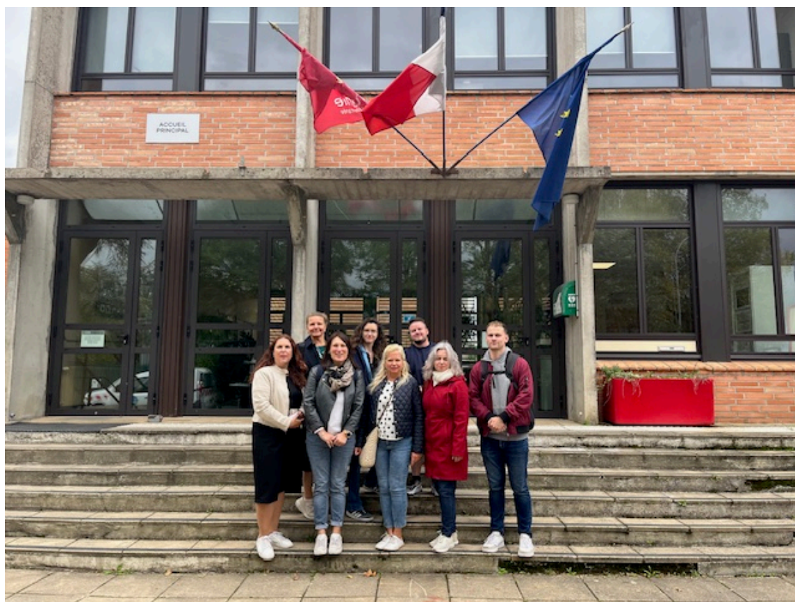
Visite du lycée d'Albi Fonlabour et échanges avec les équipes pédagogiques