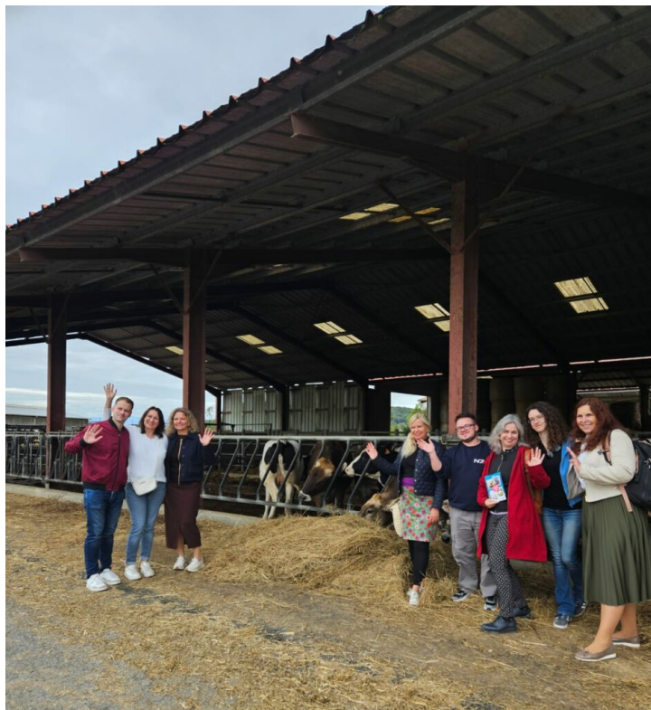
Visite de l'exploitation laitière du Lycée de Vic en Bigorre