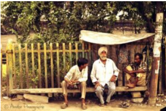
Indous, le trio