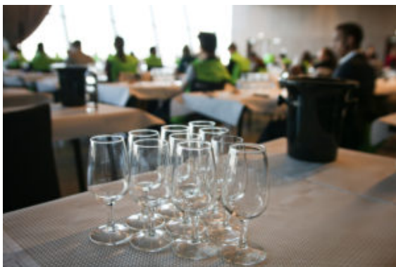
CJPV Européen – Concours des jeunes professionnels du vin au SIA 2020