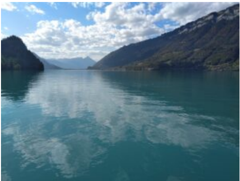
Stage élevage et production en Suisse – Lac de Breins