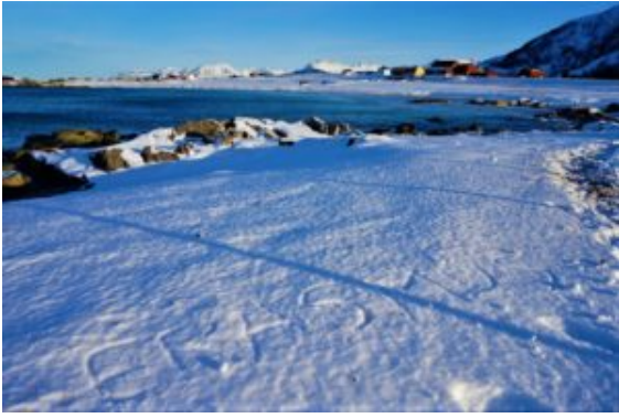
Un séjour Erasmus+ aux Lofoten en Norvège