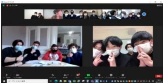
Webinaire d'échange entre élèves français et japonais