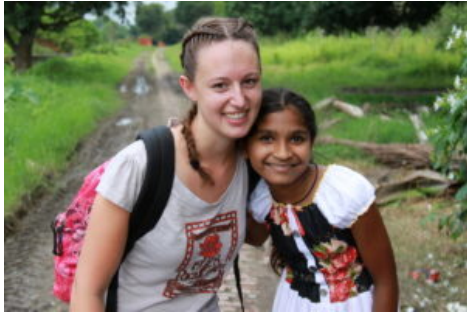
Rencontre à Pentnagar en Inde