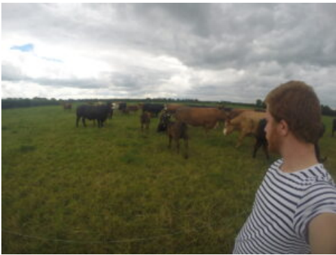
Stage ACSE en Irlande, crédit photo Charles Malabirade