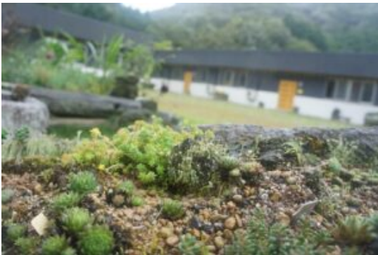
Refuge Ark de Sasayama – Japon