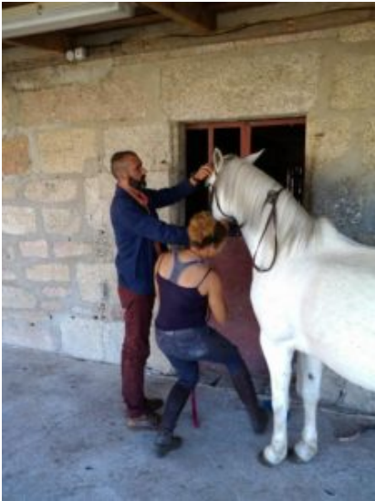
Stage Hippiisme en Espagne

Afrique : comment coopérer avec l'Afrique sur des sujets variés de la formation professionnelle ou de l'enseignement supérieur ainsi qu'à l'appui à la construction de dispositifs de formation et au soutien et développement de l'entrepreneuriat. Retour sur les Webinaires et à la découverte d'expériences par les témoignages.