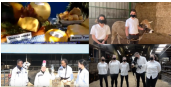
TIEA – Trophée international de l'enseignement agricole, concours 2021 sur présentation filmée (Equipes Chinoise, Argentine et Belge)