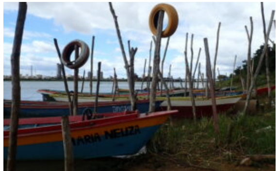
Sao Francisco de Bahia, Brésil

Vol de bernaches, Canada