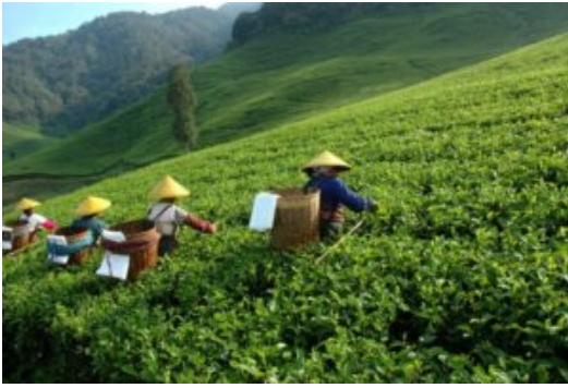
Récolte de Thé en Chine