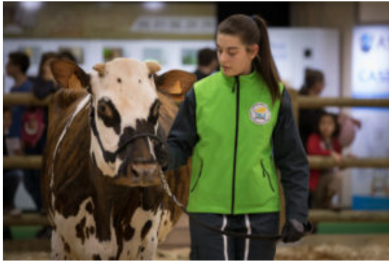
CJAJ Européen – Concours de jugement des animaux par les jeunes, SIA 2020