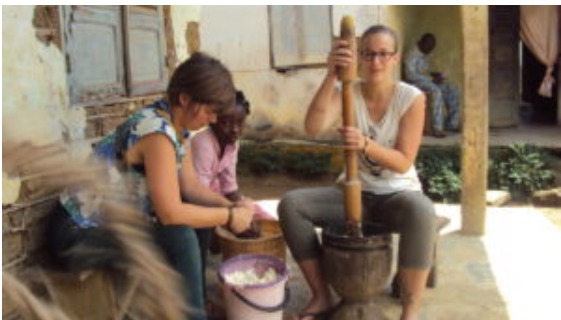
Préparation du Manioc au Cameroun