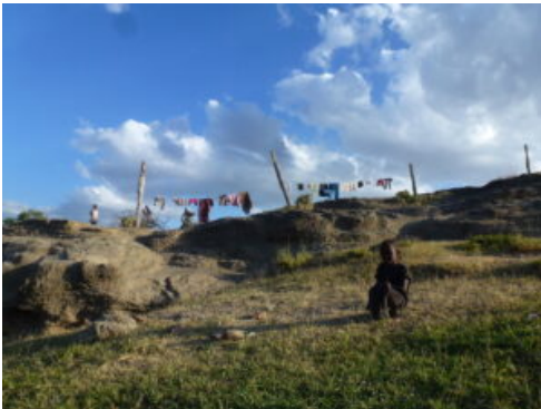
Projet interculturel au Kenya

Amérique : les projets de formation, des thématiques répondant aux enjeux mondiaux sur l'approche agroécologique, des ressources sur les modalités de déplacement au Canada.