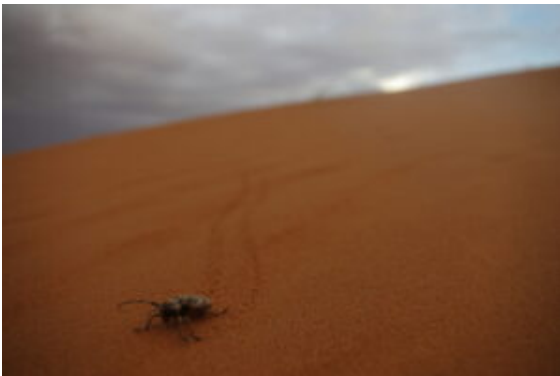
Faune du Sahara