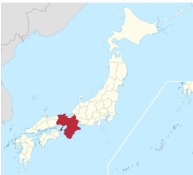
Région du Kansai