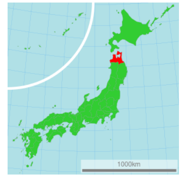
Région Aomori – Japon

Le projet qui rassemble le lycée de Briacé et celui de Kashiwagi concerne la production fruitière, et en particulier le raisin et les poires. Des échanges de pratiques