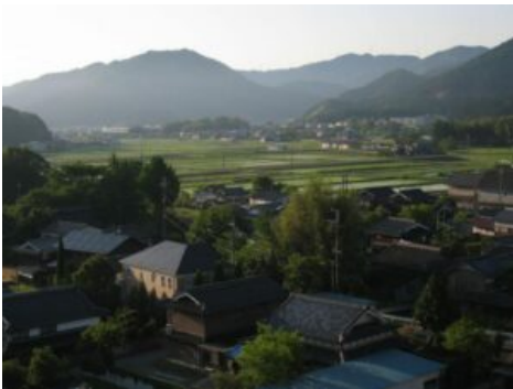
Tamba Sasayama dans la Région du Kansai – Japon