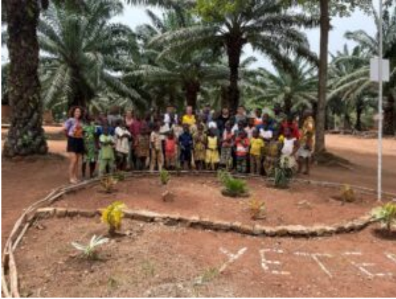
Massif réalisé au Centre Yeten

La deuxième semaine, ils ont intégré le Centre Yeten, un orphelinat accueillant 42 enfants en difficulté. Ils ont partagé le quotidien des enfants, découvert la fabrication de l'huile de palme et ont contribué à l'aménagement paysager de l'entrée de la structure.