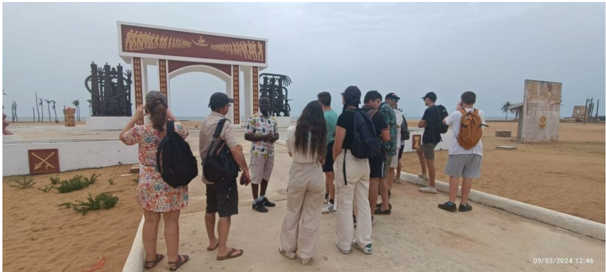
Sur la route des esclaves à Ouidah