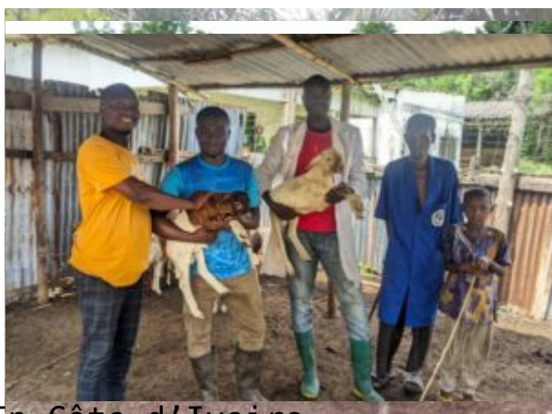
En Côte d'Ivoire Au Bénin

Les jeunes participants, leurs responsables de formation, les membres des FNCP et des représentants de 3 lycées agricoles français ont été mis en contact par le réseau Afrique de l'Ouest lors d'une première visioconférence, favorisant déjà un renforcement des partenariats entre enseignements agricoles français et béninois, ivoirien, togolais, ainsi qu'une coopération Sud-Sud.