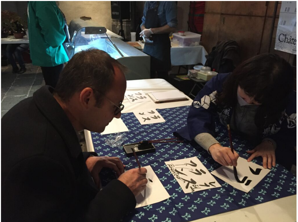
Atelier de calligraphie