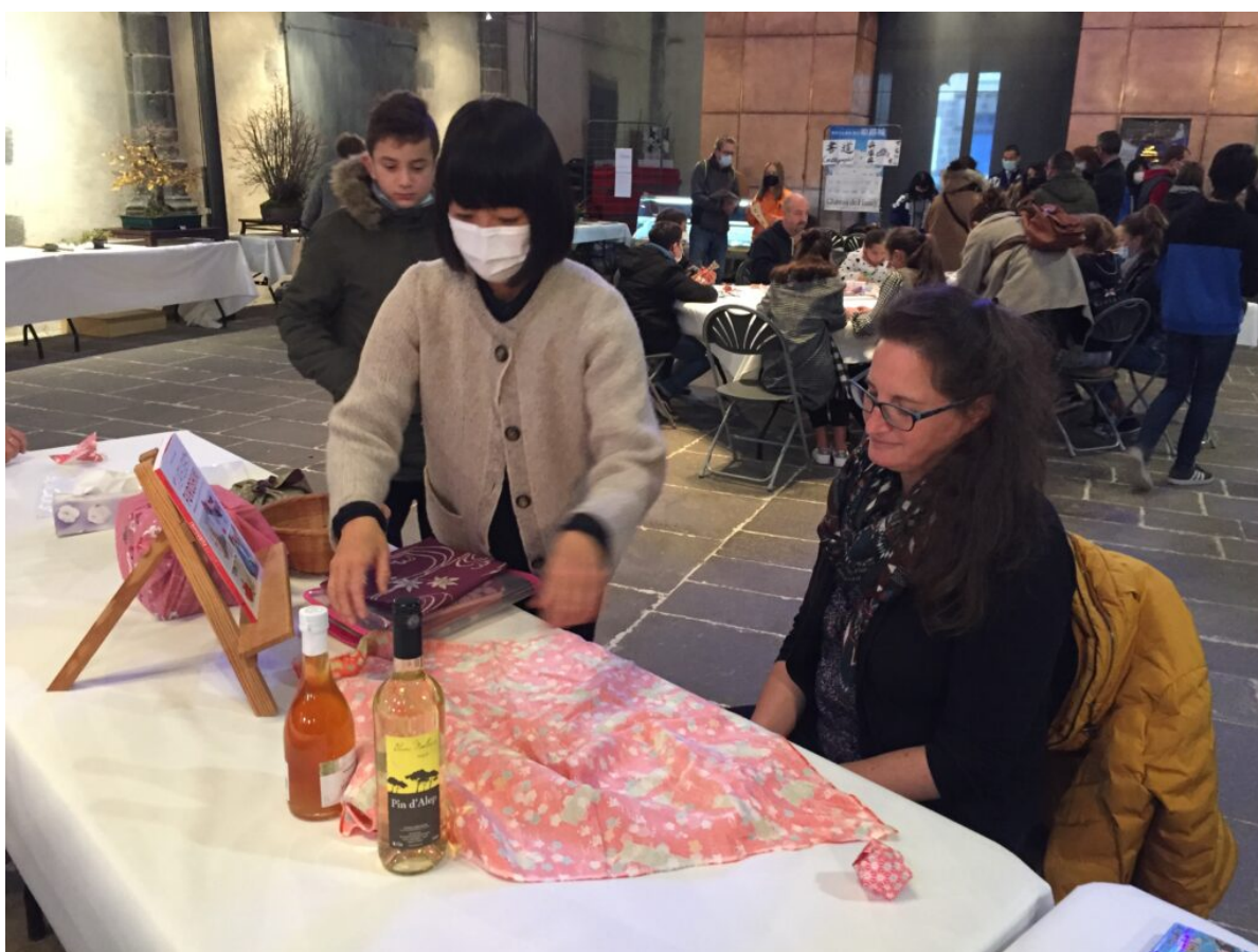
Furishiki, l'art de l'emballage en tissu

La maison du koji est venue de Clermont-Ferrand pour faire découvrir les repas sous forme de obentos et un miso fabriqué à base de lentille de Saint-Flour. Le dernier jour, l'association ichigokaï de Clermont-Ferrand, qui héberge une école de japonais, a réalisé un spectacle de danse Yosakoï interprété par les élèves et une séance de mochitsukikaï, fabrication de pâte de riz à la main, activité très rare en France.