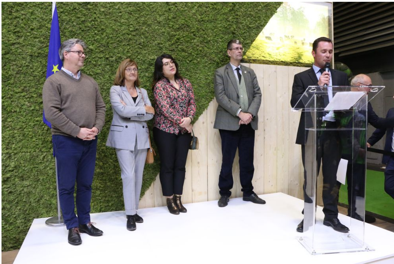
Remise des prix – Stand de la Commission Européenne – SIA 2020