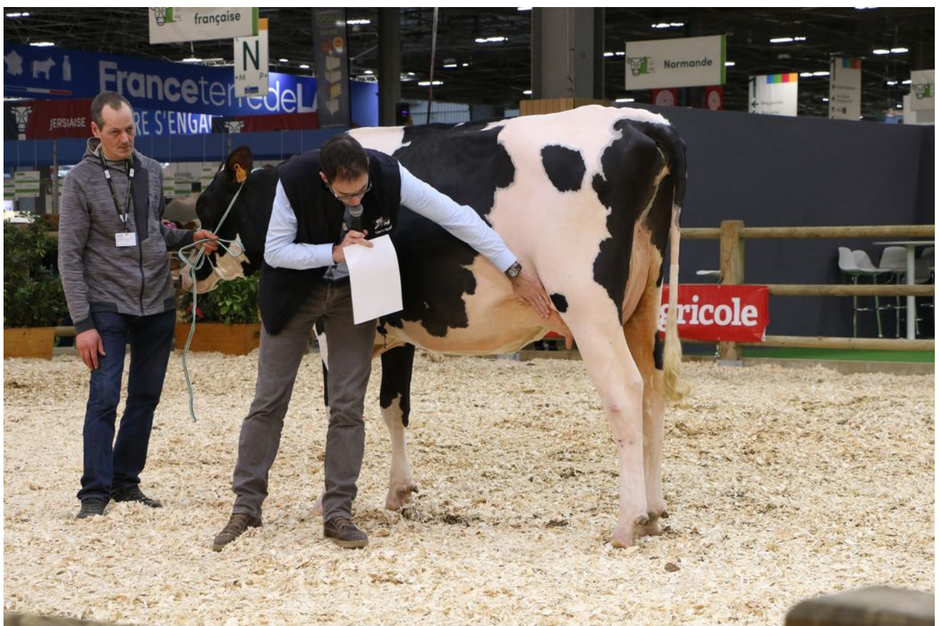
Entraînement de pointage – Prim'Holstein