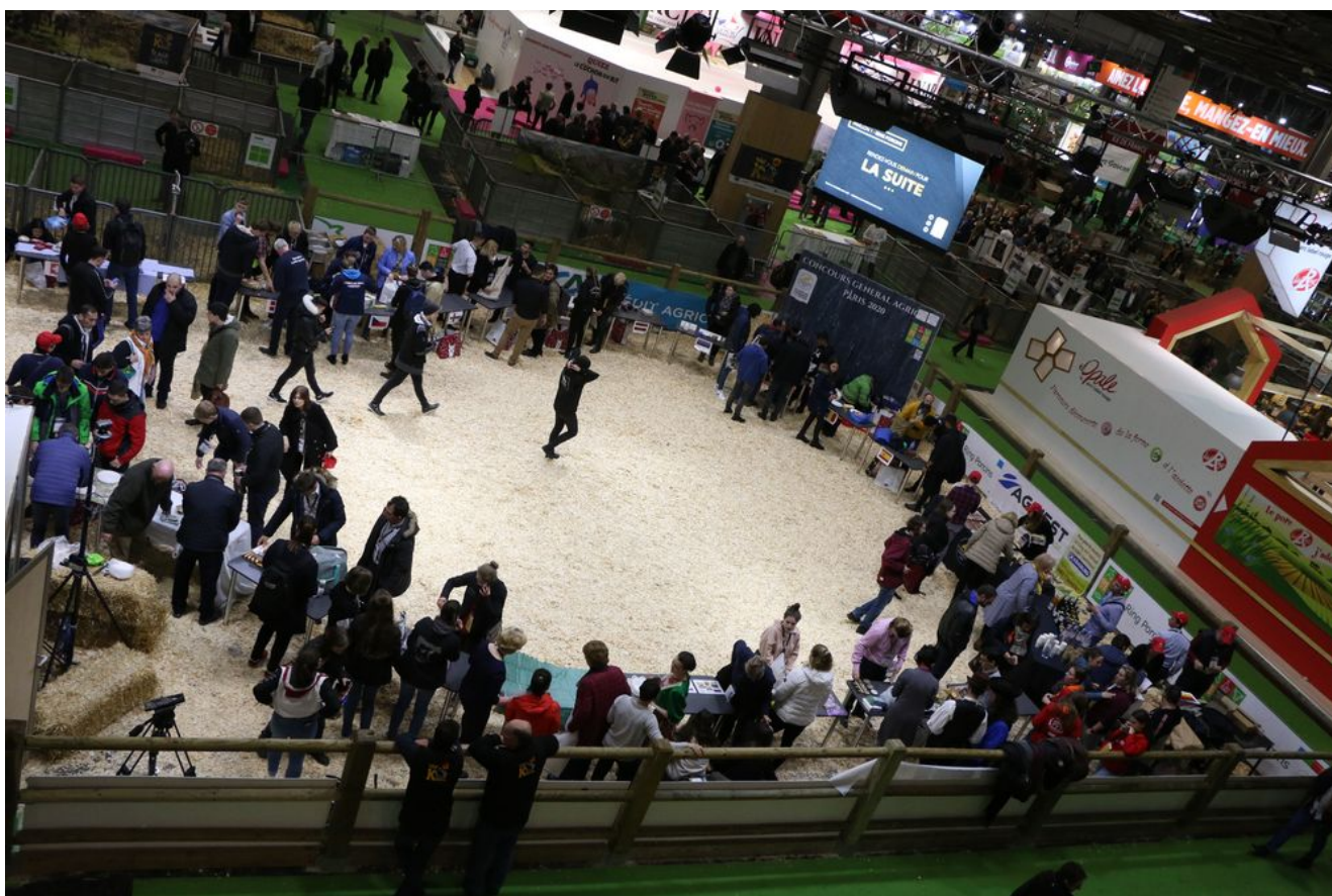
Soirée Européenne – Ring Porcin