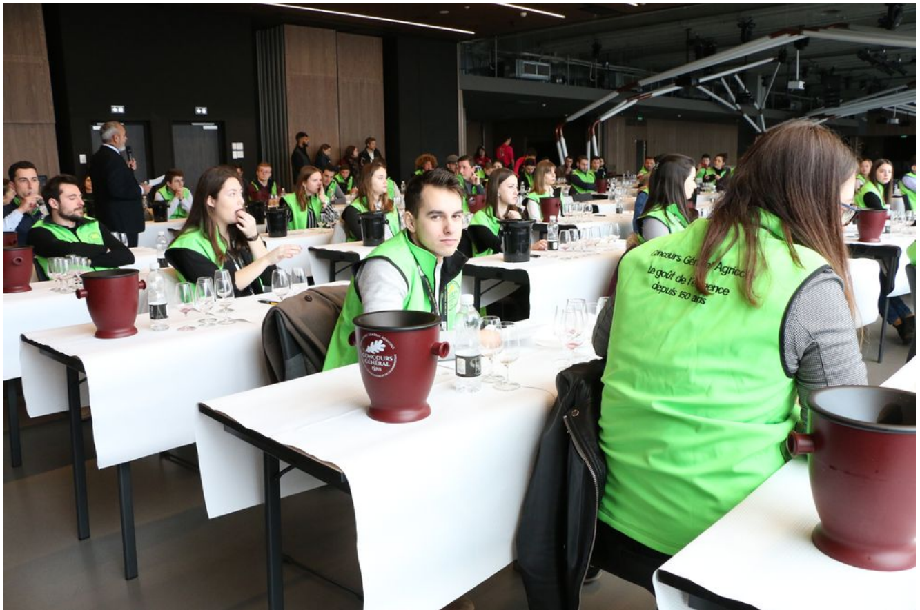
Concours des jeunes professionnels du vin – SIA 2020