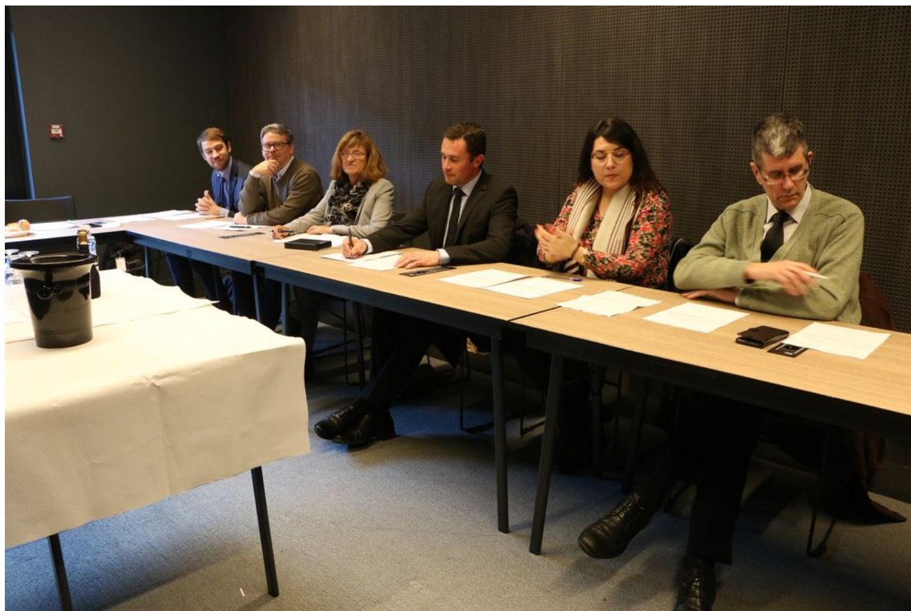
Epreuve finale du CJPV – Jury