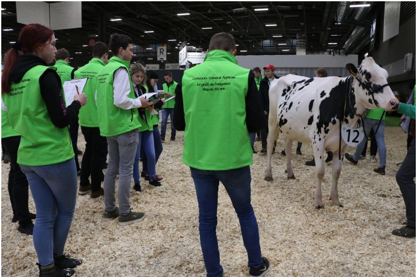
Concours de jugement des animaux par les jeunes – ring de présentation