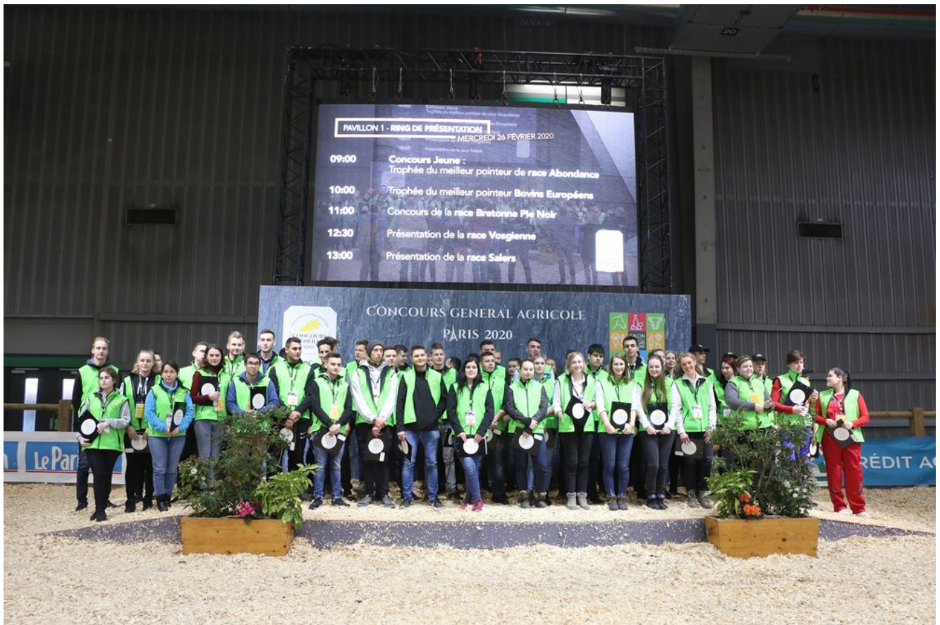
Concours de jugement des animaux par les jeunes – SIA 2020