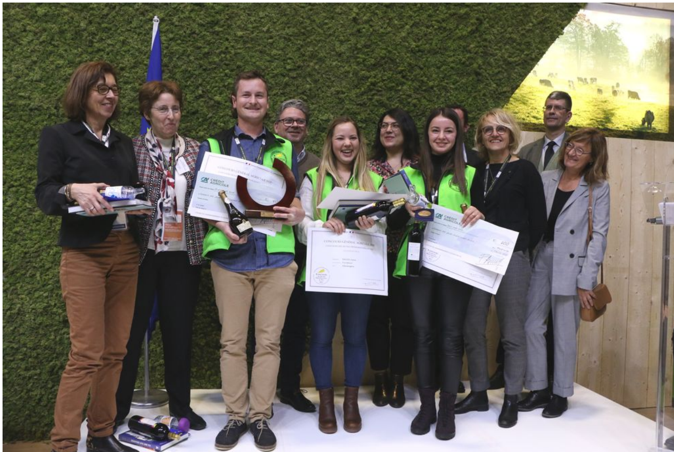
Podium des lauréats du CJPV 2020 avec le Jury