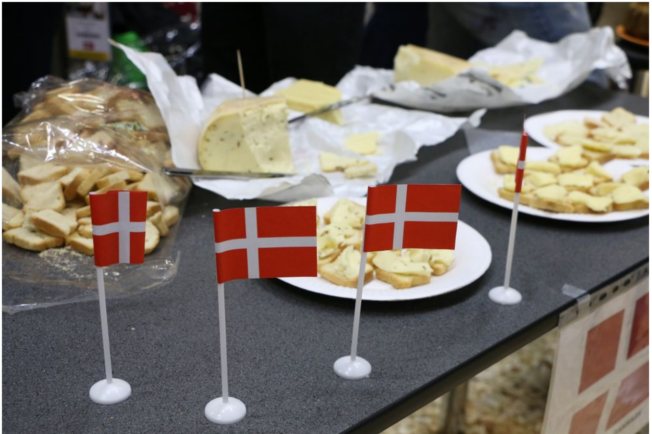
Spécialités culinaires Suisses