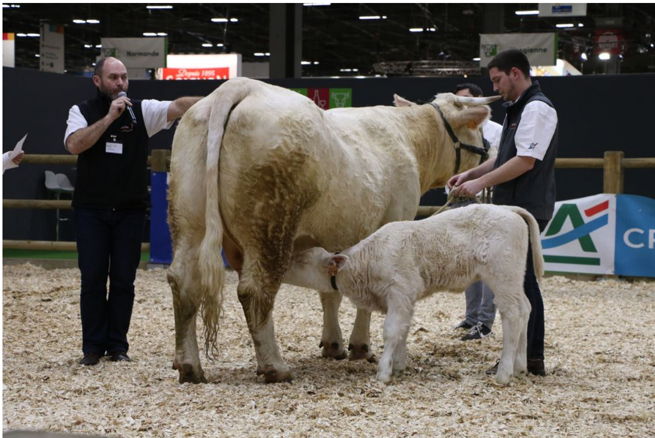
Entrainement de pointage – Charolaise