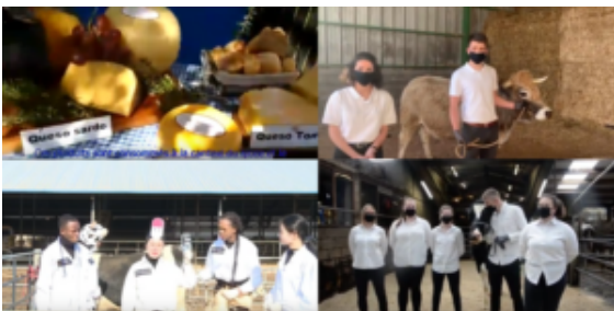
TIEA – Trophée international de l'enseignement agricole, concours 2021 sur présentation filmée (Equipes Chinoise, Argentine et Belge)