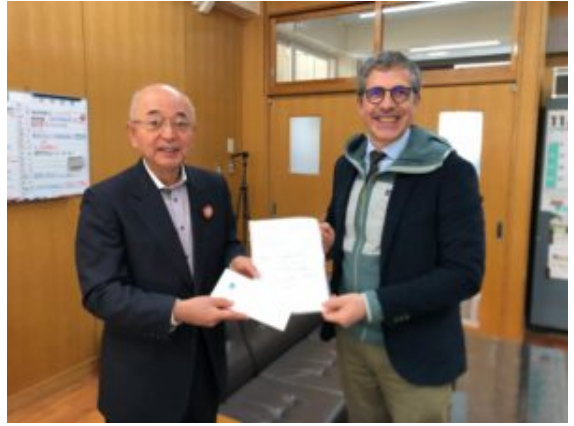
Remise de la lettre du maire d'Yssingeaux au maire de Tamba sasayama

La mission a commencé le week-end du 18 et du 19 novembre 2023 par un déplacement à Tamba Sasayama pour participer à la fête annuelle du lycée Shinonome. Il s'agit d'une ville de 40 000 habitants située dans la province de Hyogo dans la région du Kansai à l'ouest de l'île de Honshu. Les lycées agricoles japonais ont également un rôle d'animation du territoire, ainsi la fête du lycée a rassemblé différents acteurs du monde agricole et de la culture locale. Les élèves du lycée Eugénie Joubert, jumelé depuis deux ans avec Shinonome, ont animé un stand qui présentait la région Auvergne Rhône Alpes, la ville d'Yssingeaux et leur lycée. Grâce à un partenariat avec une marque française de boules de pétanque, les élèves ont fait une animation autour de ce sport qui a rencontré un vif succès. Les élèves ont dormi dans une maison traditionnelle au toit de chaume et ont pu découvrir le visage d'un Japon rural assez méconnu des touristes concentrés surtout sur les grandes villes. L'animateur du réseau Japon a pu remettre au maire de Tamba-Sasayama une lettre de proposition de partenariat écrite par son homologue de la ville d'Yssingeaux.