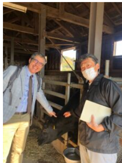
Rencontre du responsable d'exploitation agricole devant une jeune vache wagyu – à Tochigi

rencontre a permis de travailler sur la préparation et l'organisation du prochain webinaire des lycées agricoles français et japonais qui portera sur le rôle de l'enseignement agricole dans l'attractivité des métiers du vivant et le renouvellement des générations, thèmes au cœur des préoccupations du futur agricole des 2 pays.