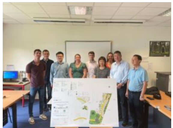
Le design final du jardin de l'ami-thé franco-chinois

La deuxième journée fut bretonne. Dans un premier temps, la délégation se rendit sur le site d'Hennebont du Campus du Morbihan afin d'y rencontrer les équipes et d'inaugurer le chantier du parc de l'ami-thé franco-chinois. Son design a été conçu grâce à un concours entre apprenants chinois et français. La synthèse des deux projets lauréats a été effectuée par un formateur d'Hennebont et a repris tous les concepts que les étudiants ont voulu insuffler.