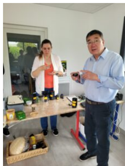
La dégustation du

La présentation des installations s'est terminée avec la dégustation des premiers thés élaborés avec des feuilles de théiers, ayant grandi dans un établissement agricole français. Le goût a plu à la délégation chinoise et là encore des conseils furent apportés afin de permettre à la partie française d'améliorer son produit.