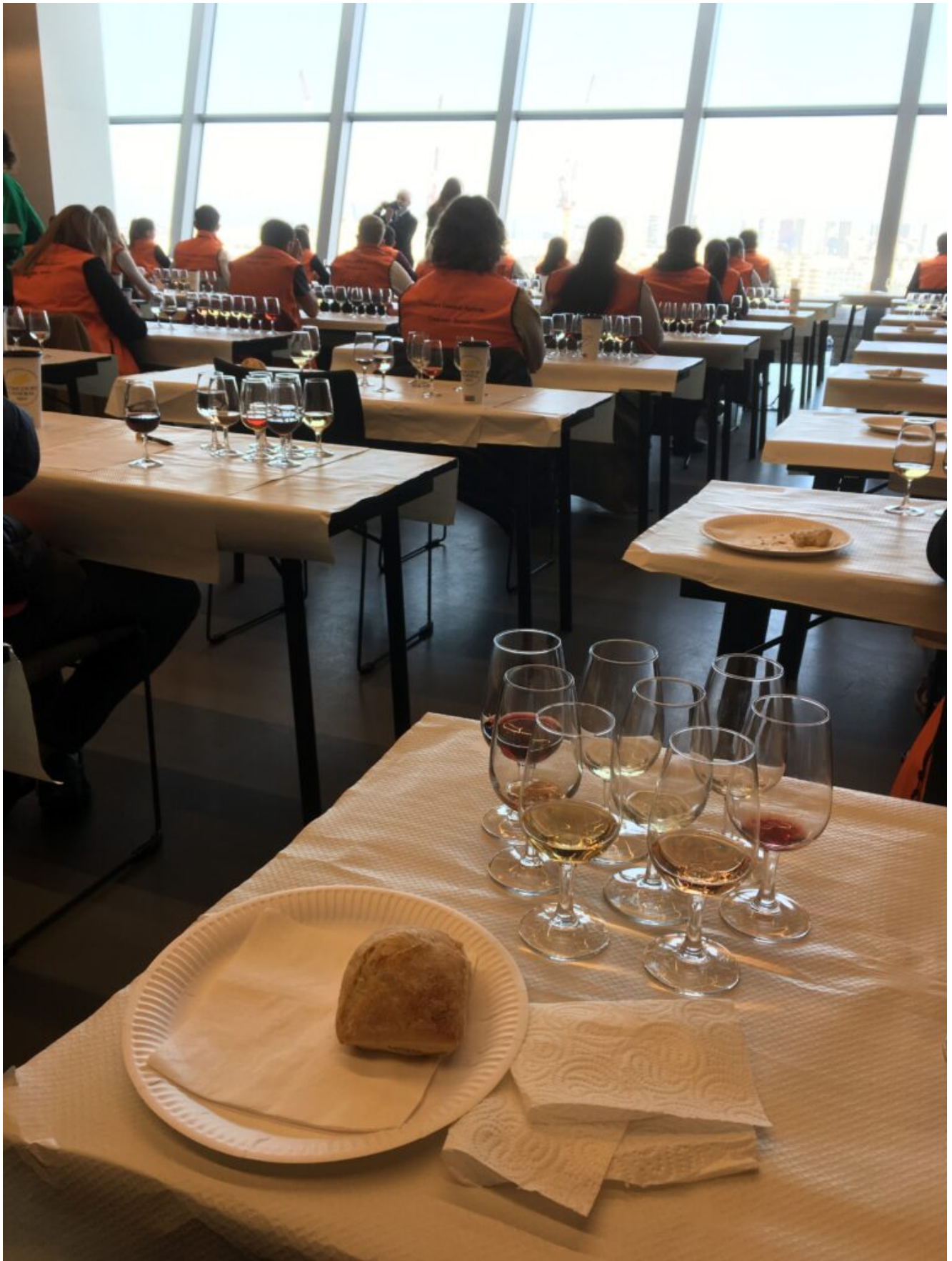
Condition de concours CJPV