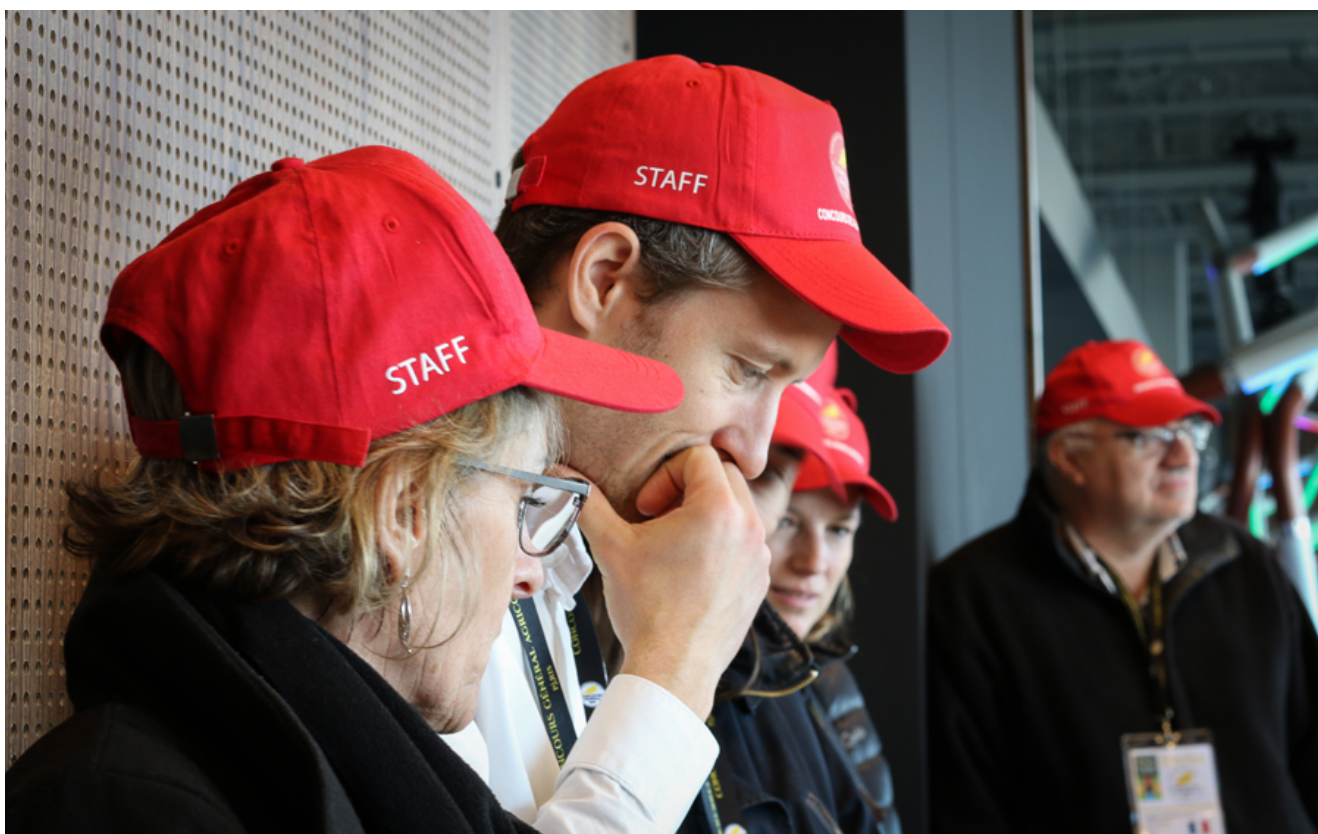
Debrief par le staff