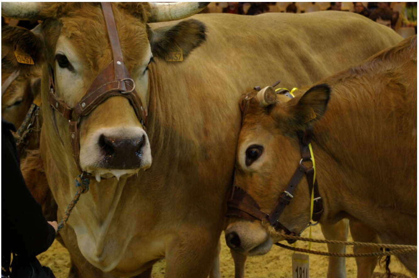
Cours de pointage