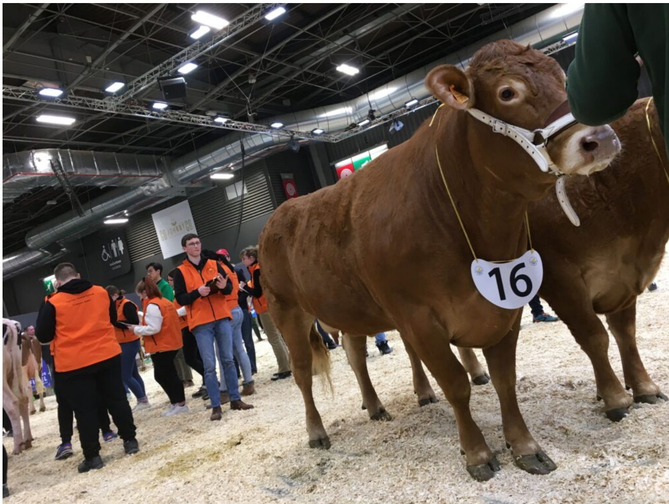
Epreuve de pointage – CJAJ