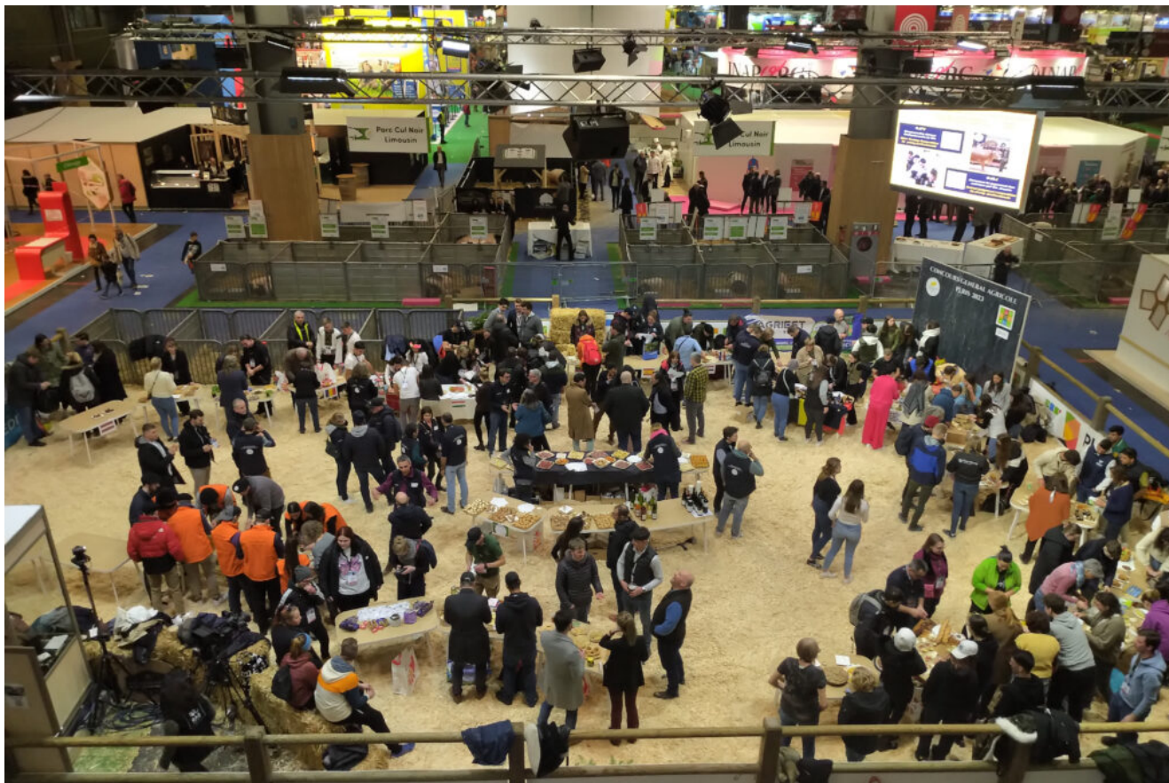
Soirée européenne sur le Ring Porcin