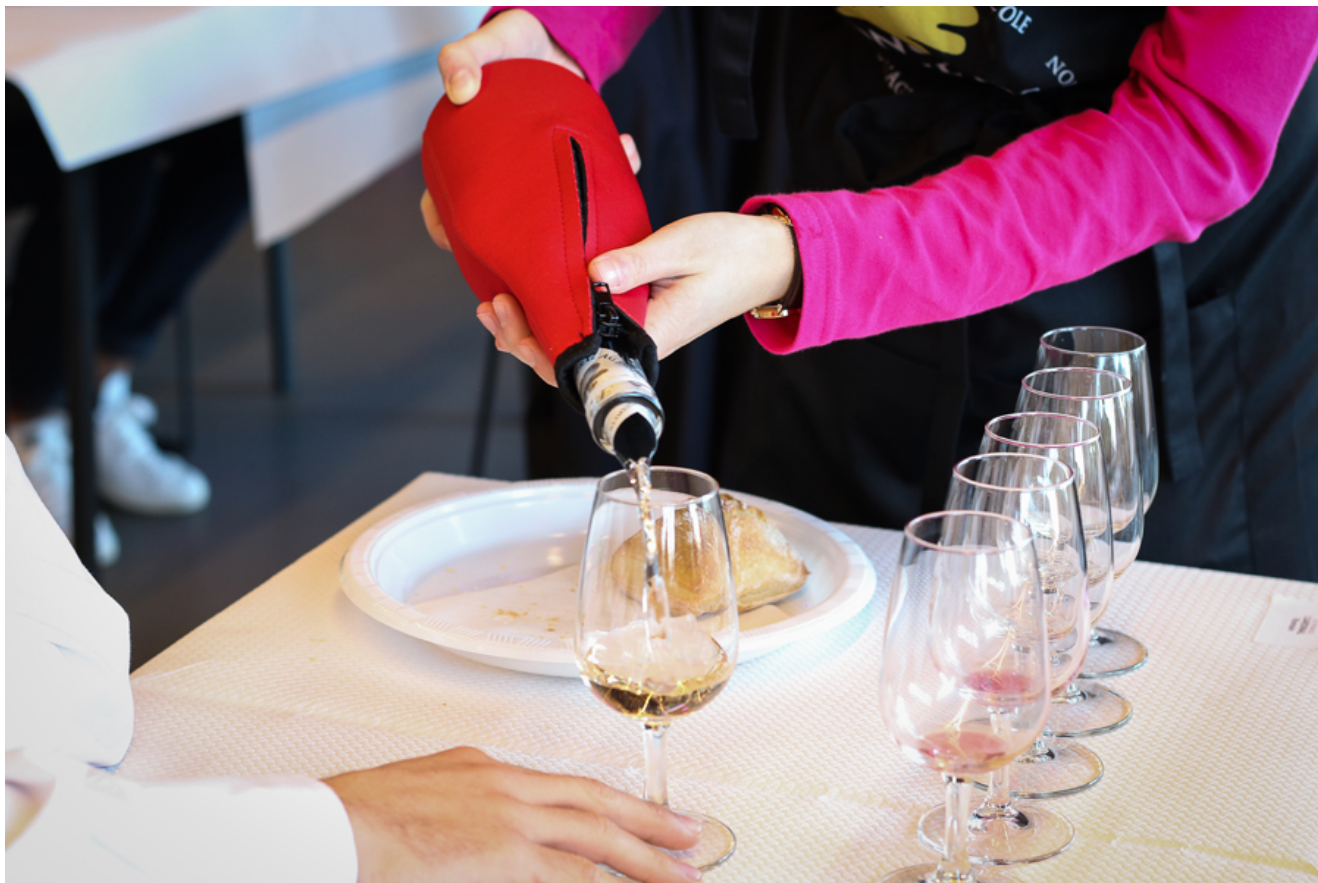
Epreuve de dégustation