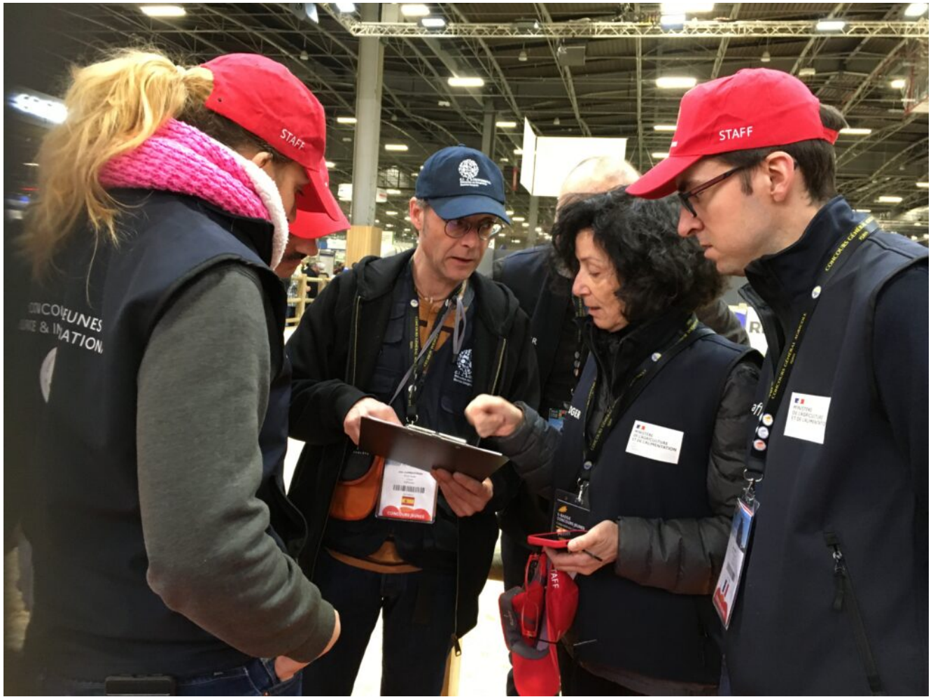
Soutien du staff