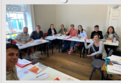
Classes at Atlas Language school