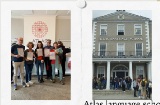
Atlas language school