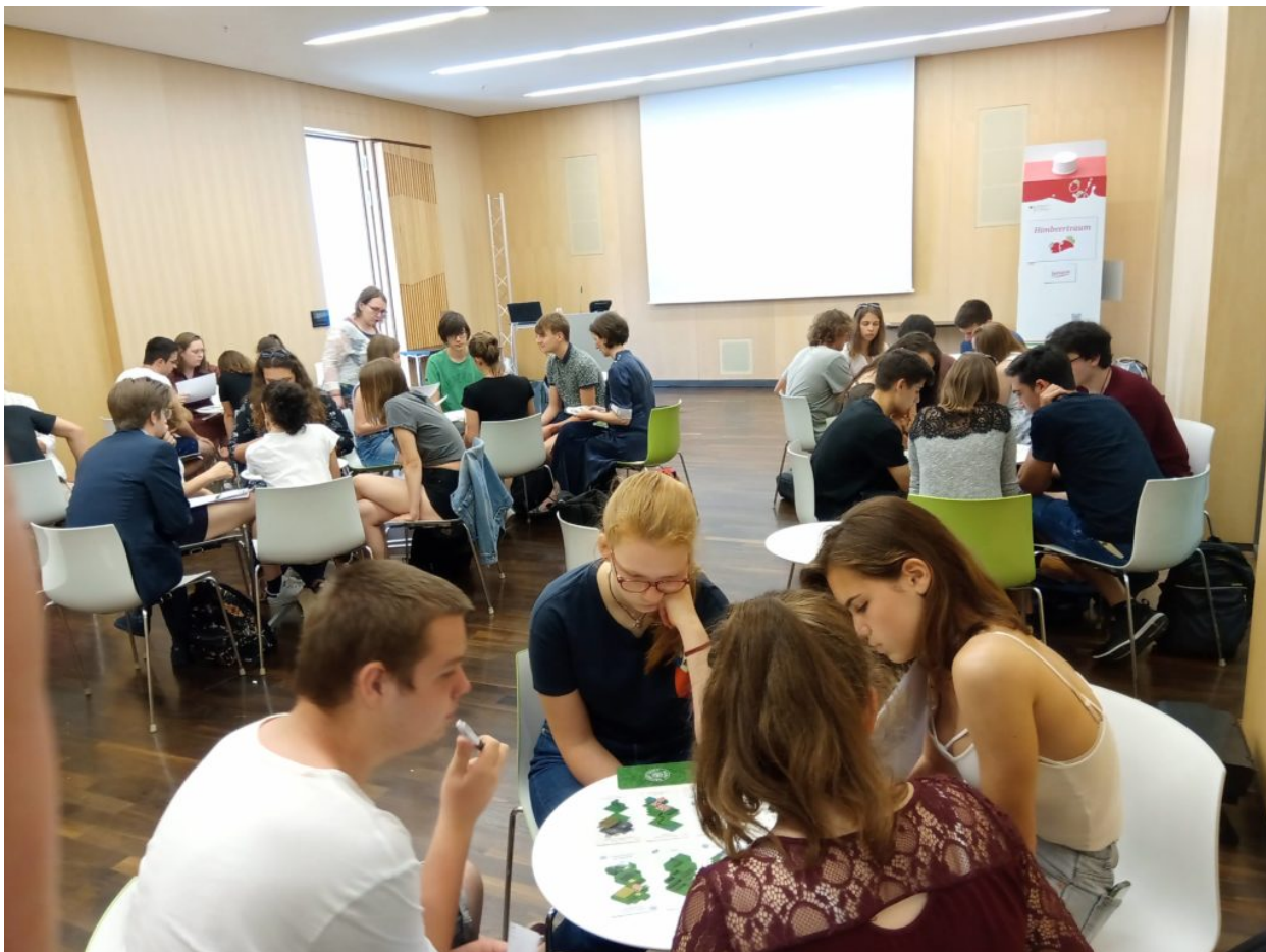
Séquence AGROCHALLENGE, le jeu de l'agroécologie au ministère de l'agriculture d'Allemagne