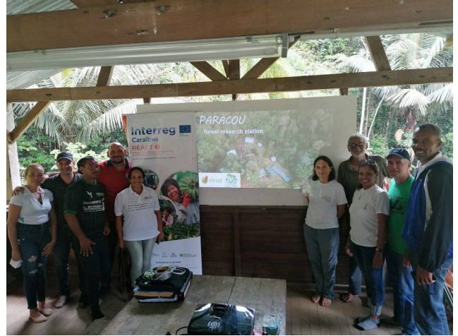
Atelier station expérimentale du Cirad

Des ateliers sur les sites du CIRAD stations COMBI, PARACOU, Kourou ont été réalisés et des échanges entre