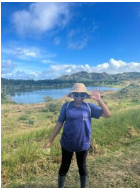
Sur le site du projet de captation d'eau

En conséquence, à la suite d'une réunion avec les agriculteurs et les résidents concernés, les autorités avait pris la décision de développer la zone de captage afin que tous les agriculteurs en aval puissent avoir accès à l'eau. C'était l'occasion pour les participants de vivre une immersion sur les sites avec les techniciens de la BADMC durant les sessions d'entretien du plus grand système d'irrigation des cultures de la Barbade. Ce système permet de distribuer chaque année quelque 2.000.000 mètres cubes d'eau de source et de puits non potable à 650 raccordements agricoles. Il s'étend sur 14 districts agricoles à Spring Hall à Sainte-Lucie, à Gibbon's Boggs et à Christ Church.