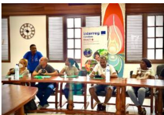
Échanges avec le conseil municipal de la ville de Sinnamary en présence du 1er vice-président de la collectivité territoriale