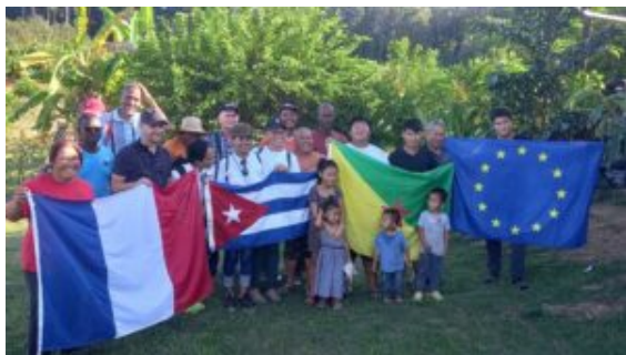
Réception des chercheurs Cubains par la coopérative des agriculteurs d'Iracoubo