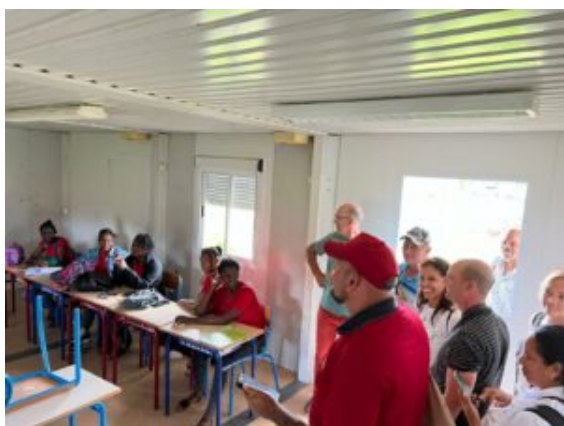
Échanges salle avec les élèves du LPA de Macouria

D'après la délégation Cubaine : « La mission scientifique en Guyane a été fructueuse, il a été possible de participer à des activités d'intérêt pédagogique, scientifique et culturel, des projections de travaux ont été discutées avec les partenaires pour les activités futures ».