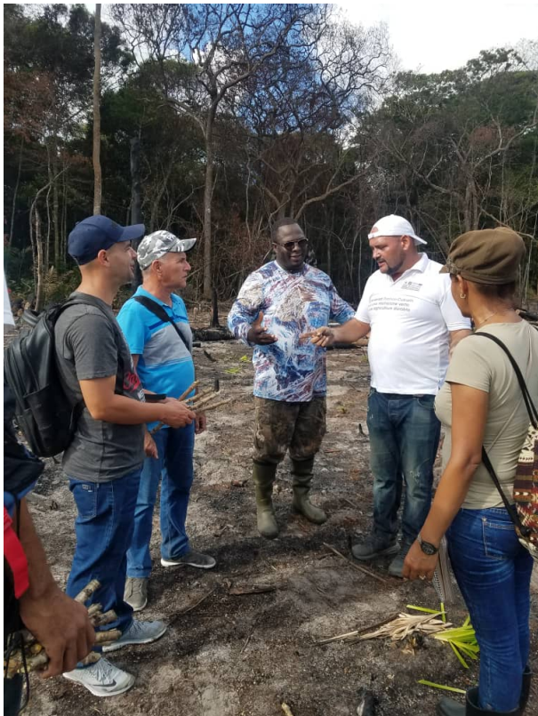
Participation au Mayouri planté sur une parcelle agricole à Iracoubo