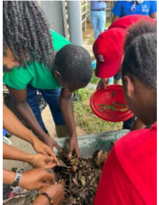
Fabrication du MAB exploitation agricole de l'EPLEFPA de Guyane par les élèves