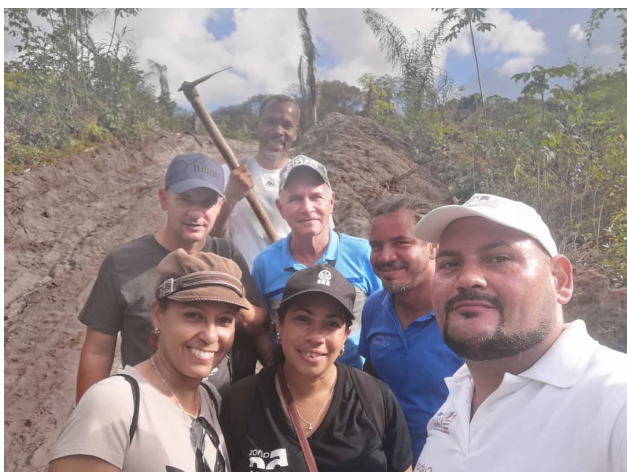
Participation au Mayouri planté manioc

Dans le cadre du module M59 du Bts DARC, les élèves et étudiants ont participé à la fabrication d'un MAB local Macouria. Ces échanges et ateliers ont eu lieu sur l'exploitation du lycée agricole de Macouria avec les enseignants techniques et le chef d'exploitation.