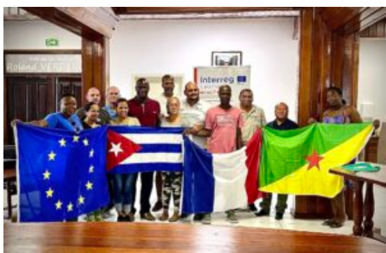
Rencontre avec le 1er vice- président de la Collectivité Territoriale de Guyane et de l'équipe Municipale de la ville de