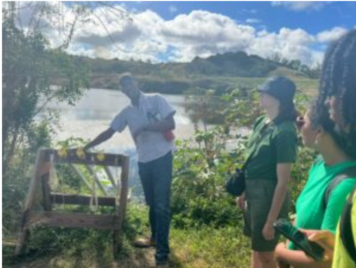
Sur le site du projet de captation d'eau