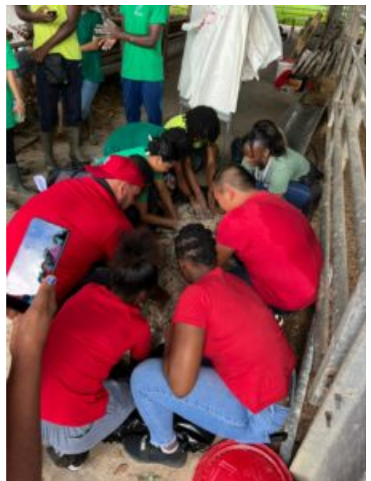
Fabrication du MAB exploitation agricole de l'EPLEFPA de Guyane par les élèves

Un atelier de formation conseil a été mis en place à la ferme