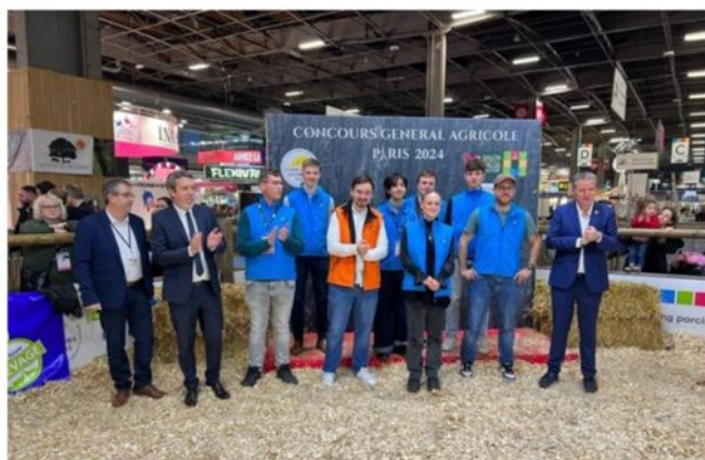
Remise des prix - lauréats CJPV/CJAJ européen

Remise des prix sur le Ring Porcin ( vidéo à visionner à partir de la minute 9'04 )