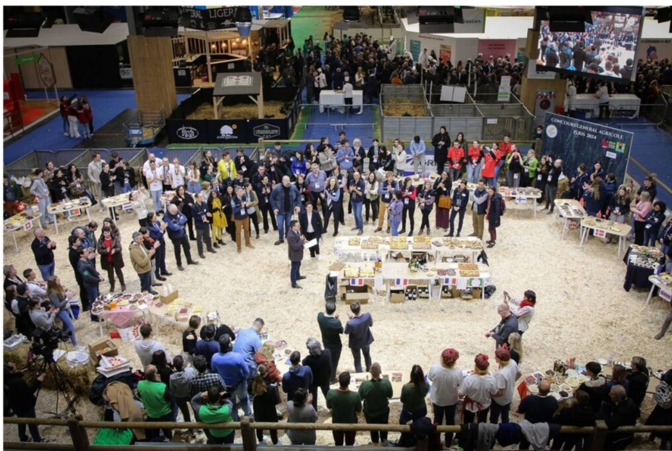
Aerial view of the « European evening » in the pig ring (pavilion 1, SIA)

Alongside the competitions, the 137 guests from 28 European countries gathered for a festive evening, during which each team shared culinary specialities from their country and enjoyed a buffet offering products from a dozen of French agricultural schools.