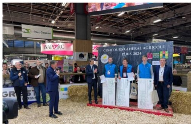
Remise des prix - lauréats CJAJ européen