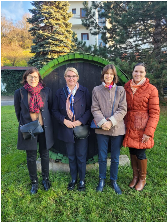
Visite du lycée viticole de Modra avec la directrice et une enseignante d'oenologie