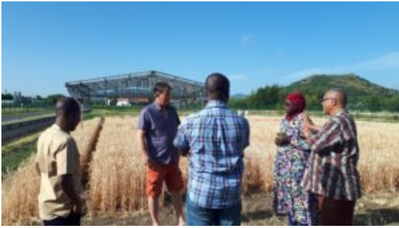
Visite du site de VetagroSup à Lyon