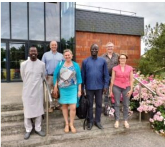
Visite d'ONIRIS, Ecole d'enseignement d'agronomie et vétérinaire à Nantes