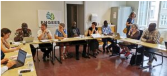
Séance de travail à l'ENGEEES, l'École National du Génie de l'Eau et de l'Environnement de Strasbourg