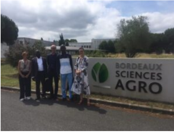
Accueil de la délégation à Bordeaux SciencesAgro