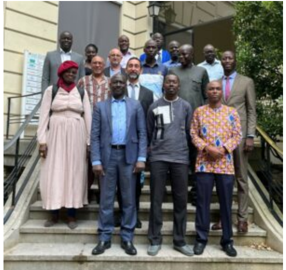
Accueil de la délégation dans les locaux parisiens d'Agreenium

Après l'accueil de la délégation et du chef du Service de gestion des étudiants sénégalais à l'étranger (SGEE) par le Délégué de l'Alliance Agreenium, les missionnaires sont partis rencontrer leurs partenaires français sur les différents sites du 20 au 24 juin 2022.