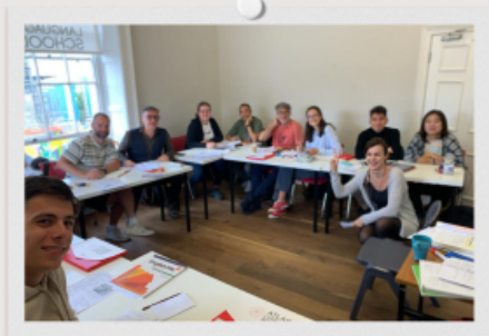
Classes at Atlas Language school