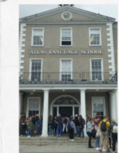
Atlas language school