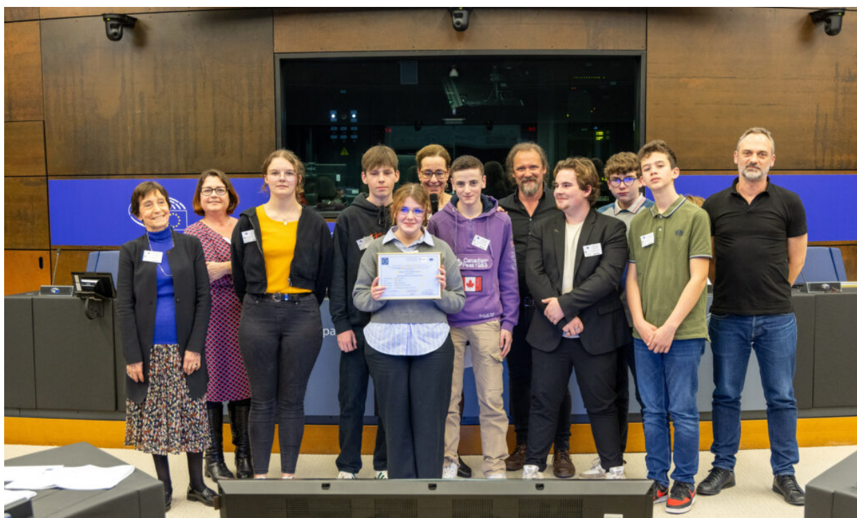
Les élèves de l'Institut Lemonnier de Caen, primés du Prix spécial du Jury 2024 de la Fondation Hippocrène