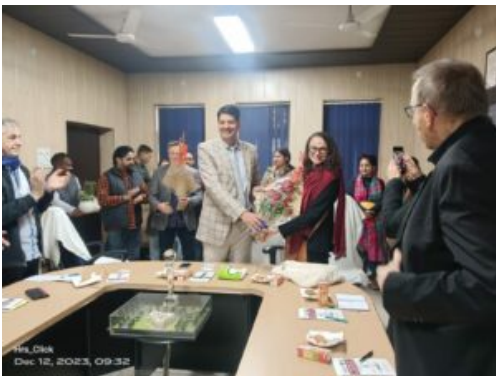
Accueil et mise à l'honneur de la délégation française