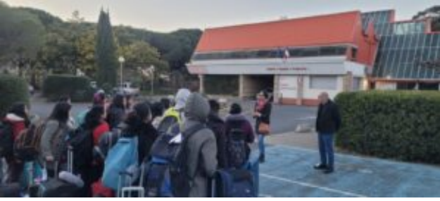
Arrivée à Théza