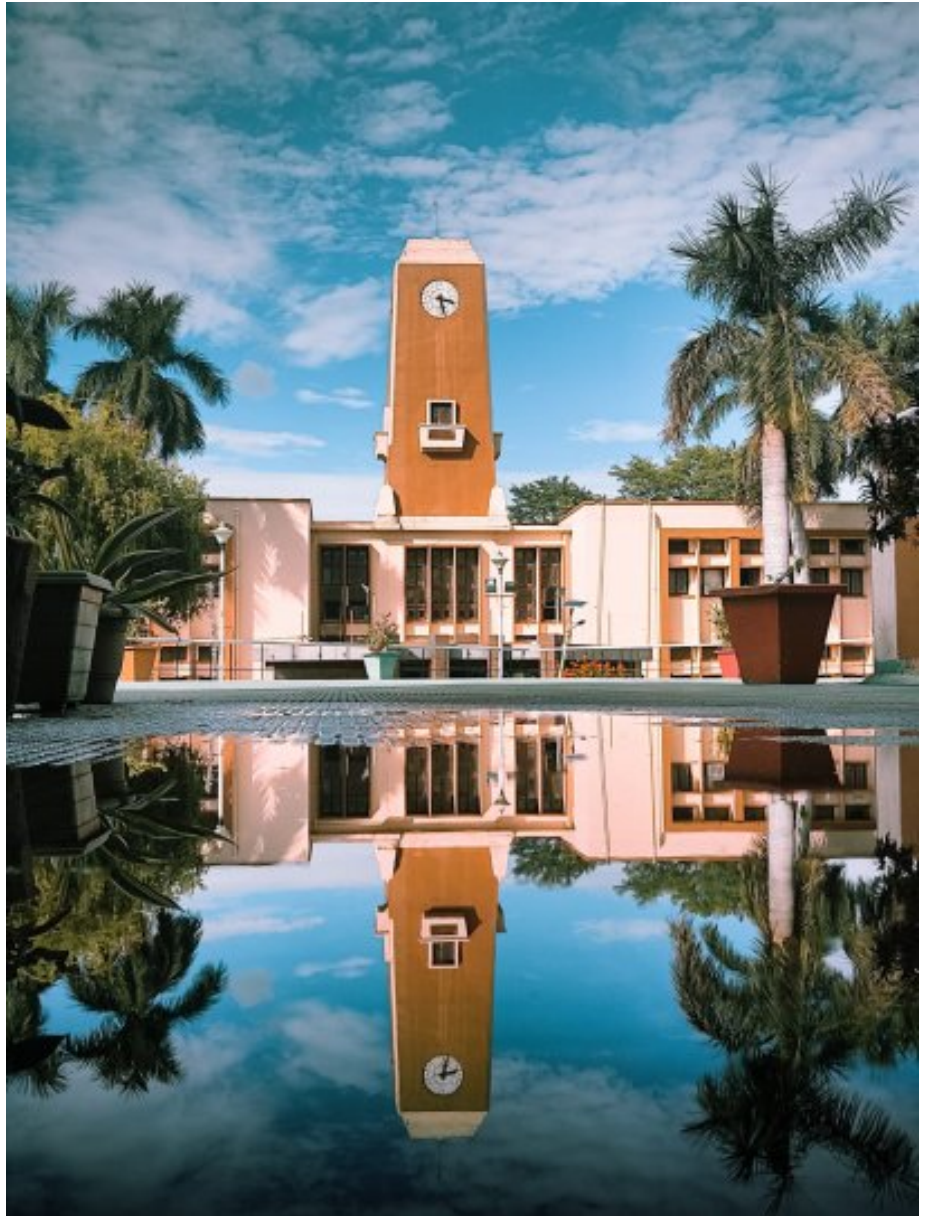
G.B Pant University of Agriculture & Technology of Pantnagar en Uttarakhand, au Nord de l'Inde