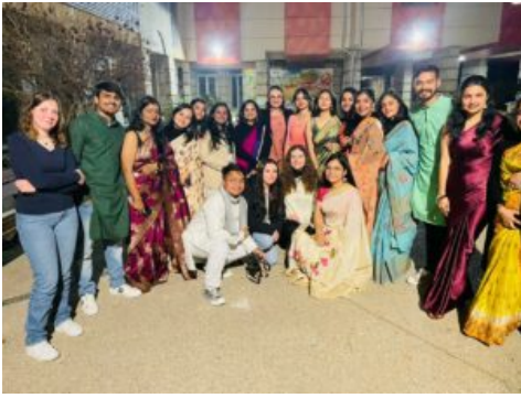
Soirée de Gala