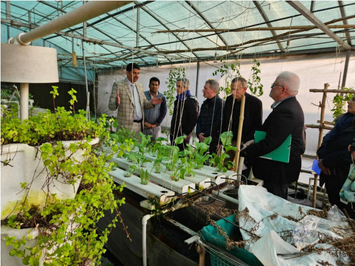
Serre expérimentale de cultures in-vitro