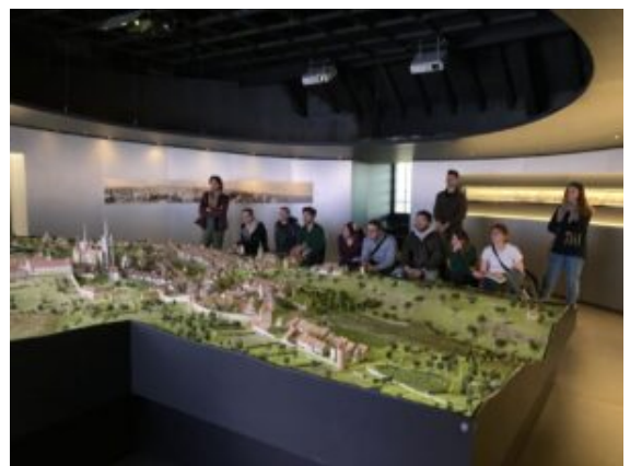
Étudiants paysagistes devant la Maquette de la ville au Musée de Lausanne

Les deux semaines et demi de ce voyage d'études étaient divisées en 3 temps : une première semaine de préparation, du