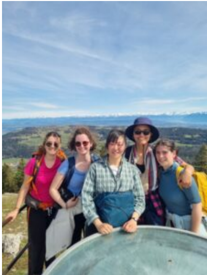
Étudiantes de Versailles et Marseille en Atelier Voyage, le long du Rhône

En savoir plus sur les objectifs du Workshop et du voyage d'études international