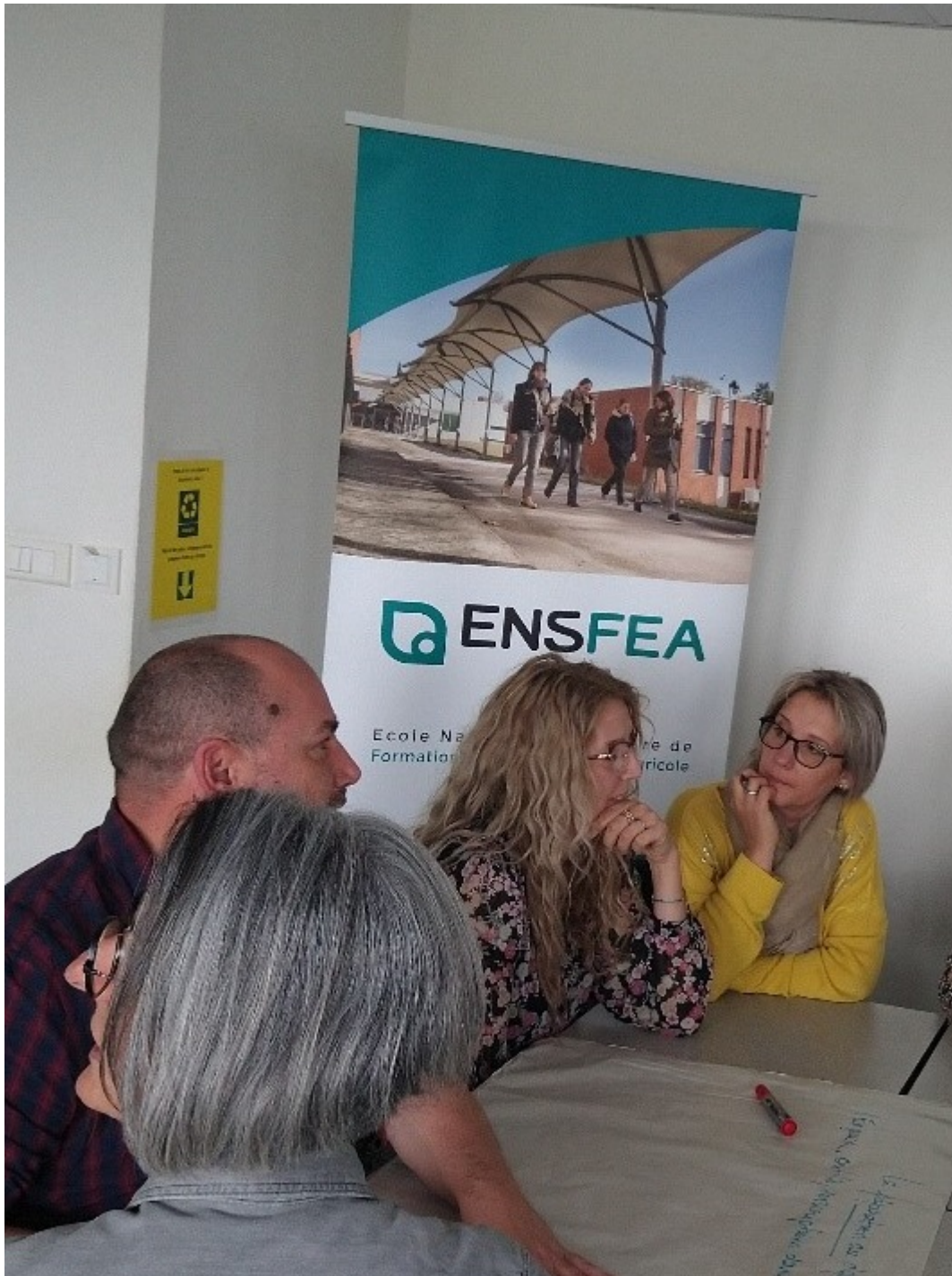
Atelier organisé par le RED sur la préparation au départ, le suivi sur place et la valorisation au retour d'une mobilité

De ux jo ur né es de fo rm at io n, in sc ri t au Pl an Ré gi on al de Fo rm at io n, on t no ta mm en t eu