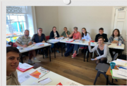
Classes at Atlas Language school