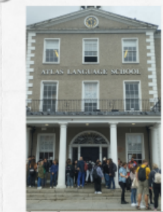
Atlas language school