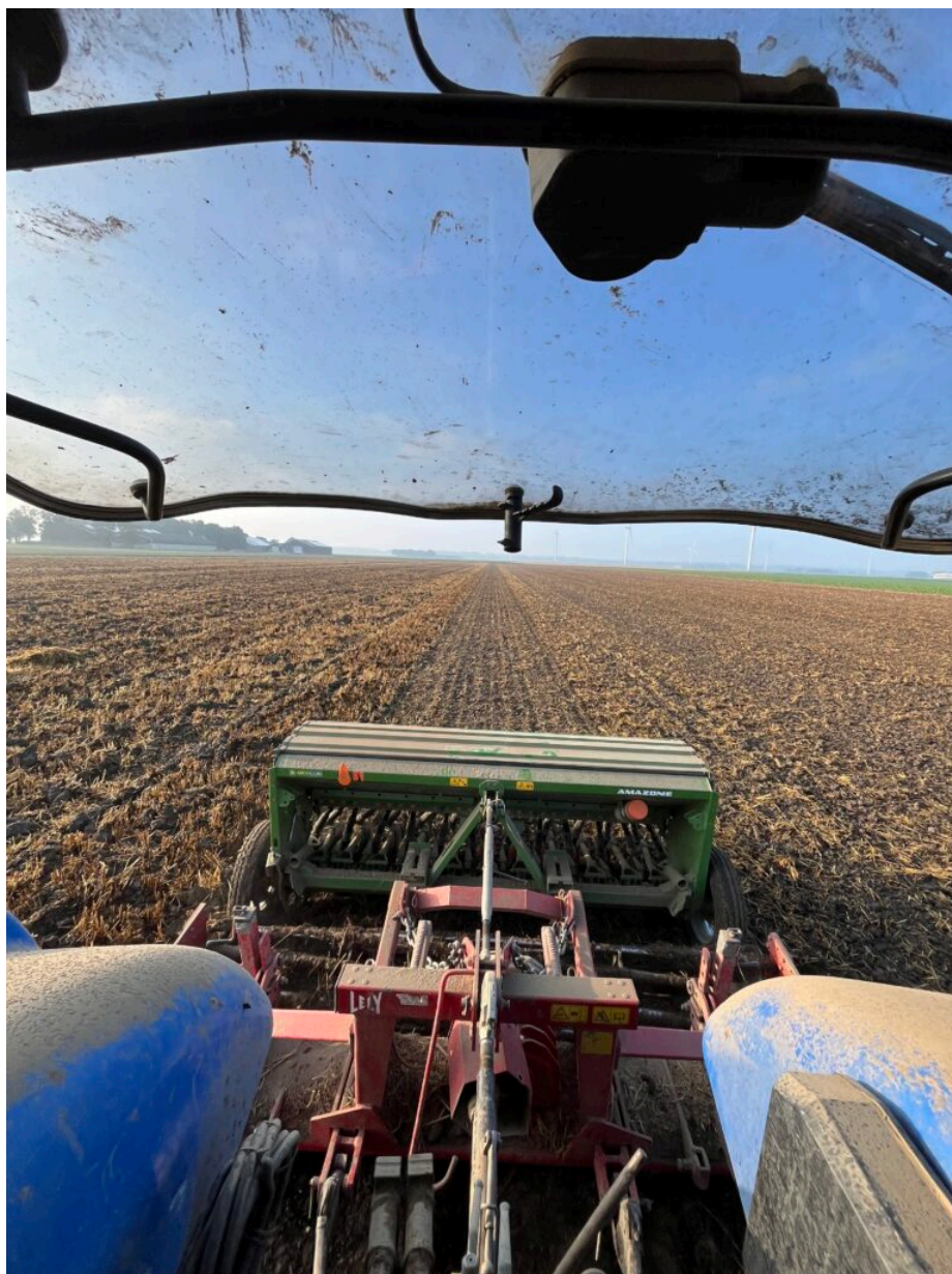
Léo Frerard, lauréat du Prix-Photo Moveagri 2024 : Un berrichon perdu au milieu des plaines du Pays-Bas

Les opportunités qu'offre le programme Erasmus + sont autant d'encouragements à faire le choix d'un parcours vers les métiers du Vivant. Ces métiers recrutent chaque année plus de 100 000 personnes, et attendent cette nouvelle génération de professionnels formés dans nos établissements : motivés, passionnés, ouverts sur l'Europe et sur le monde.