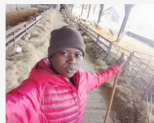
Mes trois premiers mois de volontariat