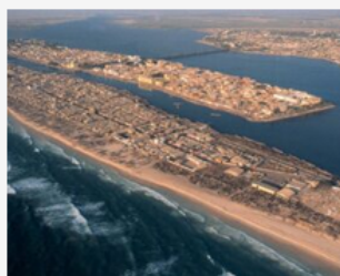
14 candidats intègrent AgreenMob 2024