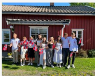
L'immersion au service des apprenants