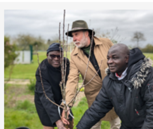
Deux semaines franco-ivoiriennes