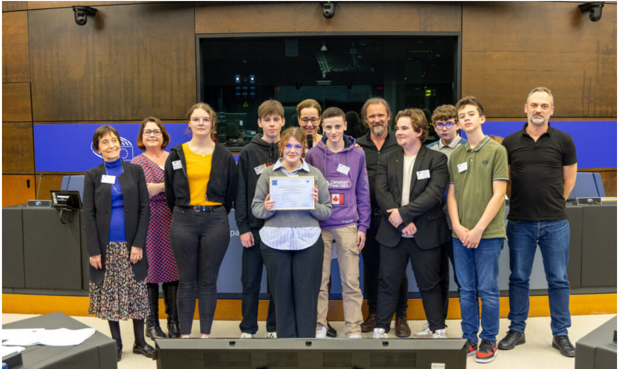
Les élèves de l'Institut Lemonnier de Caen, primés du Prix spécial du Jury 2024 de la Fondation Hippocrène

Fruit d'une belle collaboration entre une classe du lycée professionnel industriel et une classe du lycée professionnel agricole, ce projet a pour objectif de rendre compte de l'importance des mondes normands dans l'identité et la mémoire européenne. Traçant l'histoire des peuples scandinaves entre le 8 ème et 10 ème siècles, leur influence dans la création du Duché de Normandie et du royaume Normand de Sicile, ce projet nous invite à réfléchir aux influences diverses de notre patrimoine culturel local et aux valeurs communes qui ont forgé l'identité européenne. Ce projet donnera lieu à un documentaire en partenariat avec un vidéaste professionnel et à la création d'un totem en bois symbole de la coopération avec les établissements danois et sicilien.