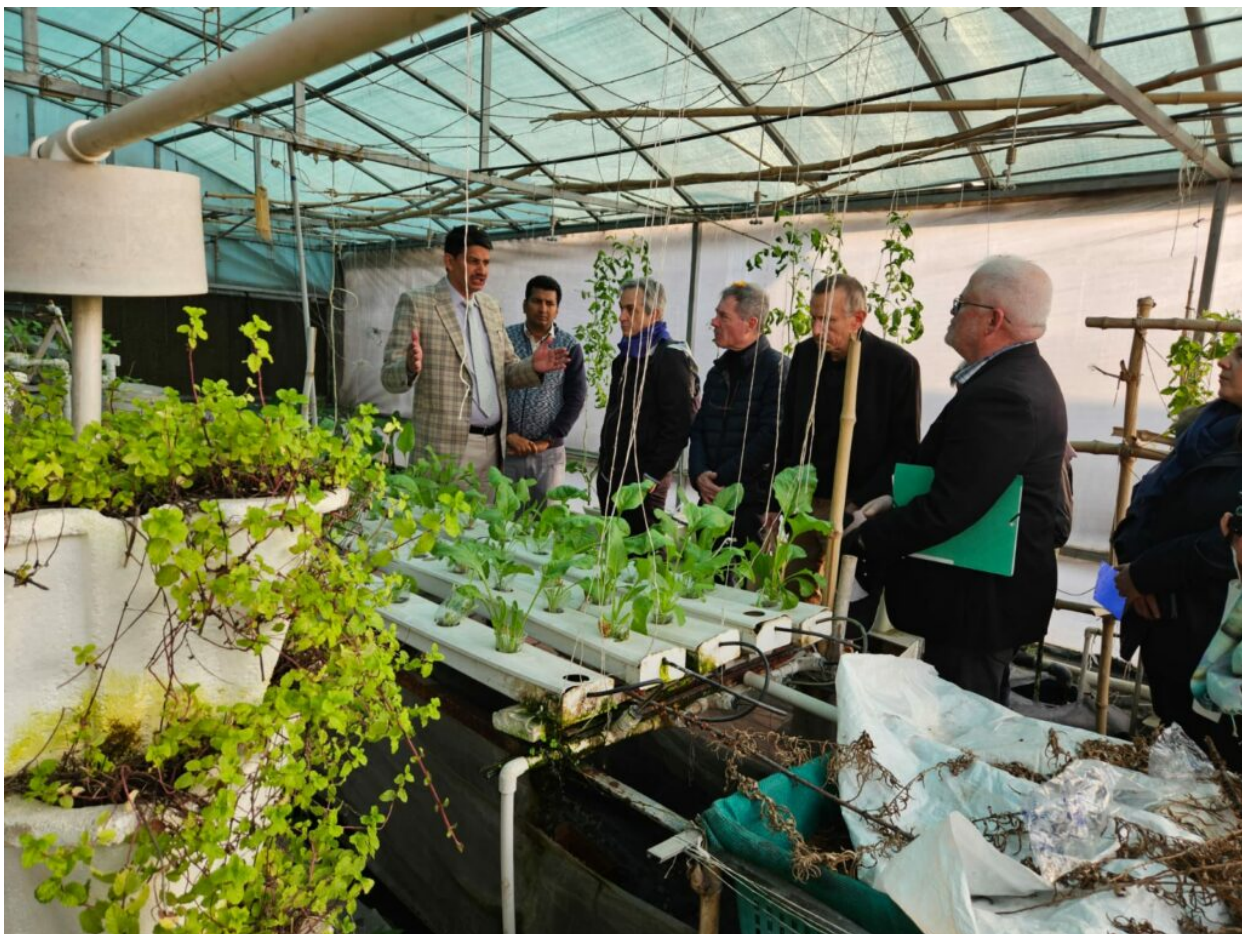
Serre expérimentale de cultures in-vitro