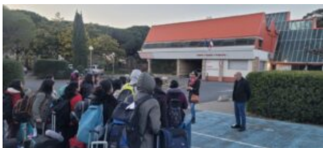
Arrivée à Théza

Depuis, chaque année, les animateurs du réseau Inde organisent l'accueil des étudiants indiens et leur stage dans une douzaine de lycées d'enseignement agricole en France. Après une semaine d'intégration au lycée de Théza à Perpignan, ils partent dans les établissements partenaires du programme DEFIAA – Developping French Indian Exchanges in Agroffod and Agronomy – et vivent l'aventure française.