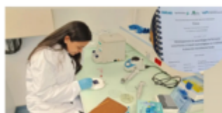
From Panthagar to ENIL Aurillac