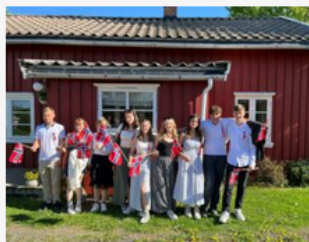
L'immersion au service des apprenants