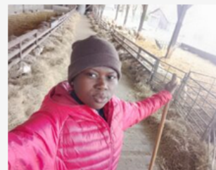
Mes trois premiers mois de volontariat