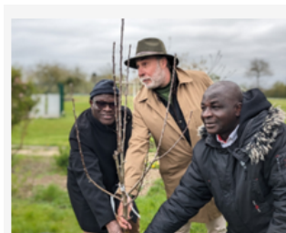
Deux semaines franco-ivoiriennes

Depuis la création du site PortailCoop, les acteurs de la coopération européenne et internationale ont transmis plus de 430 articles pour informer sur les actions et actualités qui témoignent du dynamisme des équipes en établissements agricoles, au sein des réseaux de l'enseignement agricole ou dans les écoles d'ingénieurs, vétérinaires et du paysage ainsi que dans les pays partenaires, des informations relayées par les correspondants dans les structures à l'international, et ce, depuis fin 2018, date du lancement du site PortailCoop.