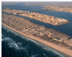
14 candidats intègrent AgreenMob 2024