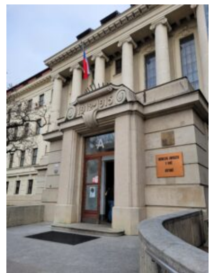
Université Mendel – Brno

Comparer nos programmes d'enseignements pour construire de futures mobilités académiques