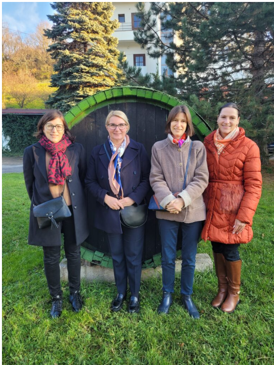
Visite du lycée viticole de Modra avec la directrice et une enseignante d'oenologie