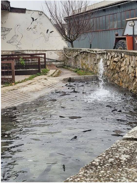
Bassin d'aquaculture au lycée d'Ivanka Pri Dunaji