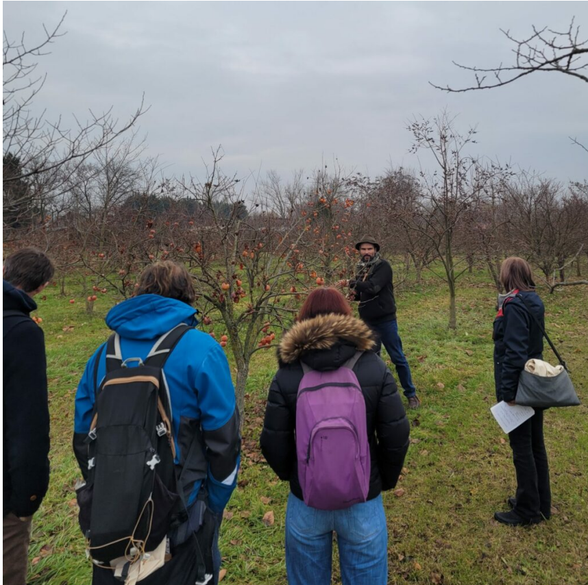
Visite du verger d'application de l'Université de Nitra

La mission a permis de rencontrer les représentants des relations internationales de l'université et des différentes facultés et de mieux connaître les unités de l'université et réciproquement expliquer les particularités des établissements français aux partenaires slovaques. Les membres de la délégation française ont visité les infrastructures universitaires et le verger d'application.