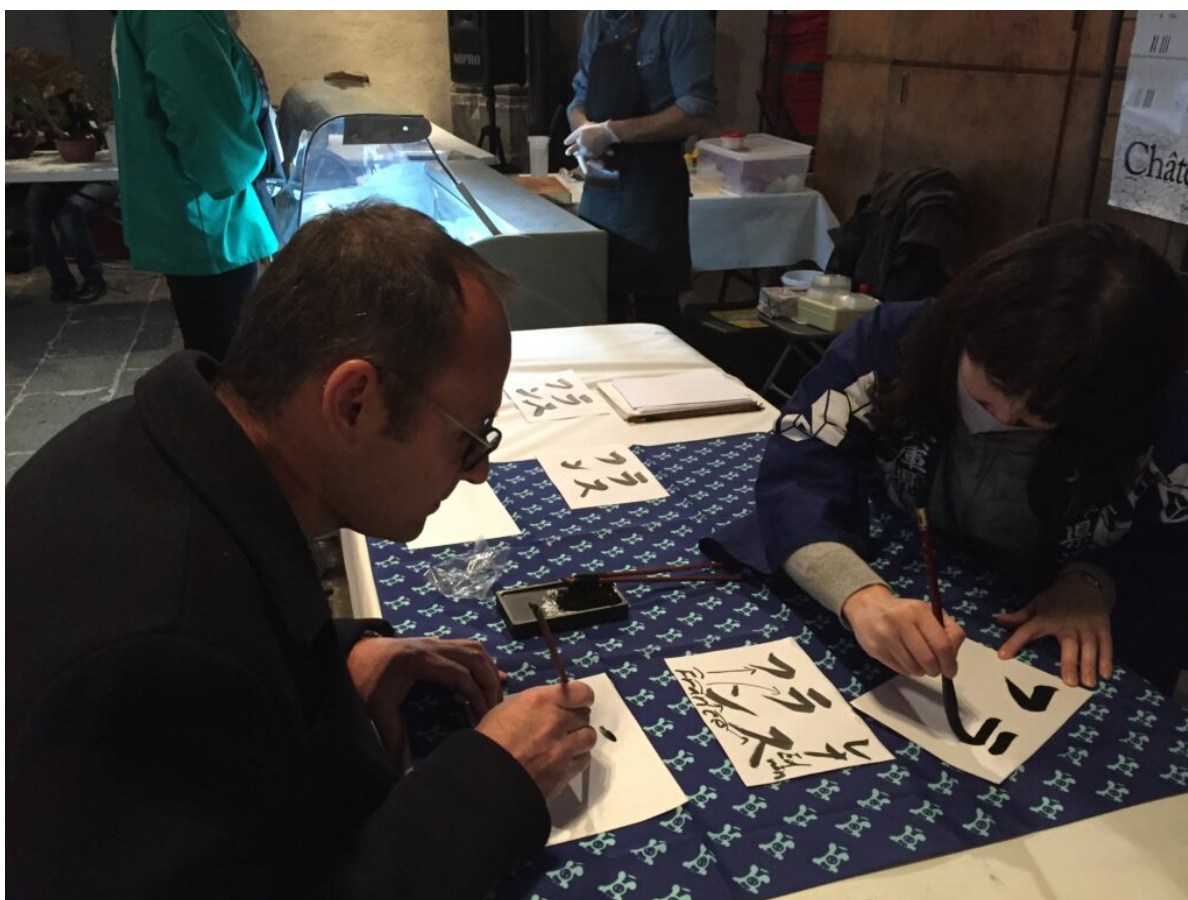
Atelier de calligraphie