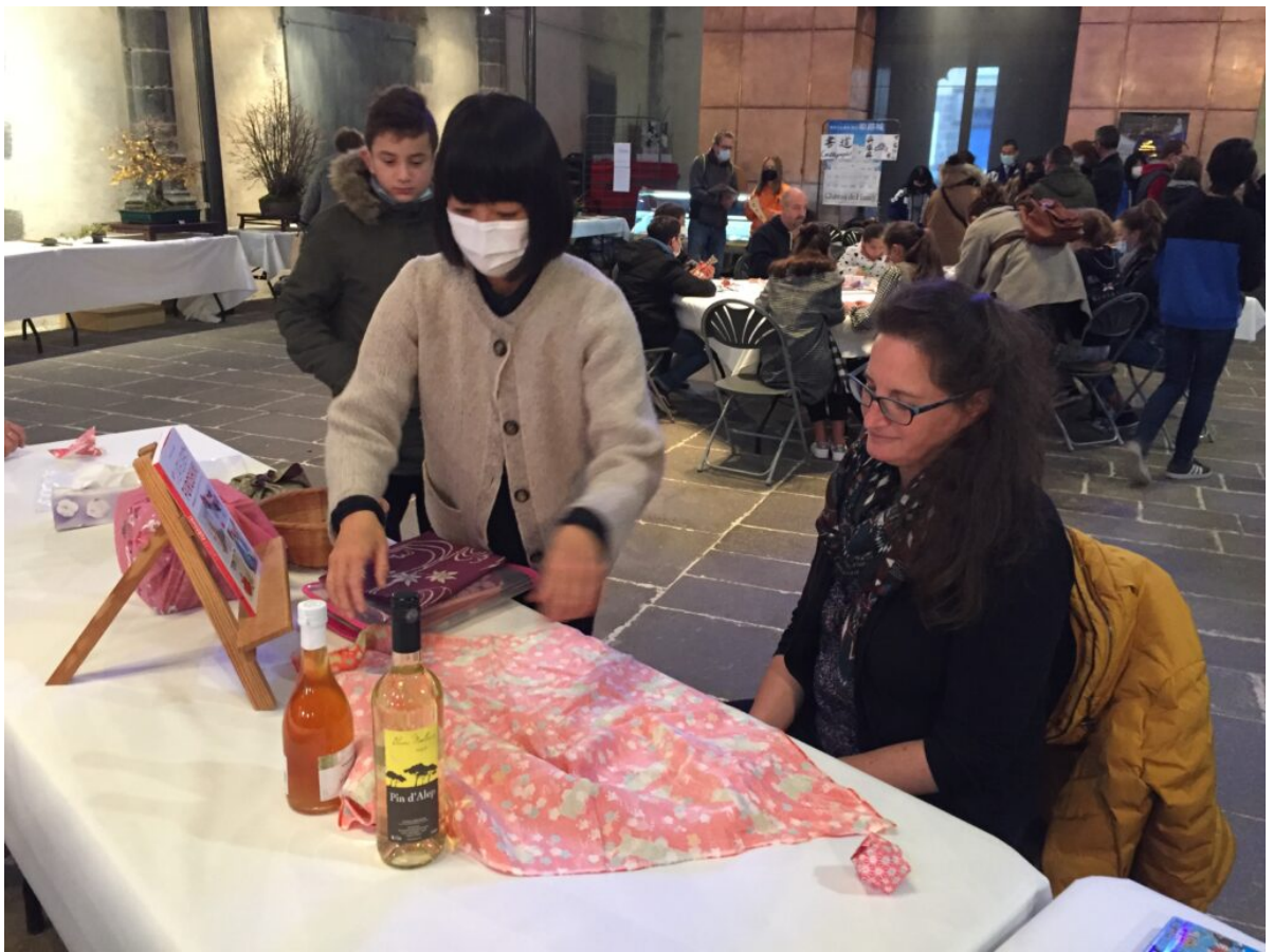
Furishiki, l'art de l'emballage en tissu

La maison du koji est venue de Clermont-Ferrand pour faire découvrir les repas sous forme de obentos et un miso fabriqué à base de lentille de Saint-Flour. Le dernier jour, l'association ichigokaï de Clermont-Ferrand, qui héberge une école de japonais, a réalisé un spectacle de danse Yosakoï interprété par les élèves et une séance de mochitsukikaï, fabrication de pâte de riz à la main, activité très rare en France.