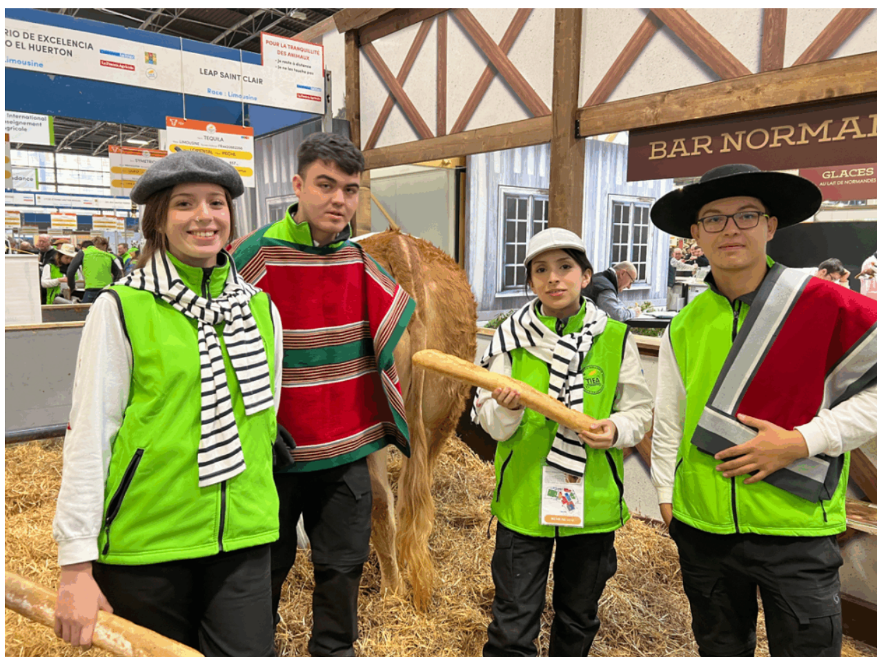
Equipe chilienne auprès de la vache prêtée par le partenaire français (LEAP Derval)

L'épreuve n° 1 de communication est composée de 2 sous-épreuves ; la réalisation d'une vidéo et la rédaction du pitch. Les élèves ont suivi le thème de l'année « L'élevage bovin, une richesse pour les territoires ! ». Puis, les candidats devaient décorer et animer la stalle de la vache en déclinant le même thème.