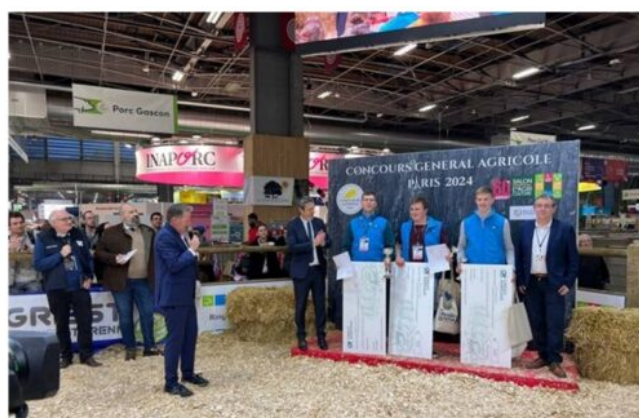
Remise des prix - lauréats CJAJ européen