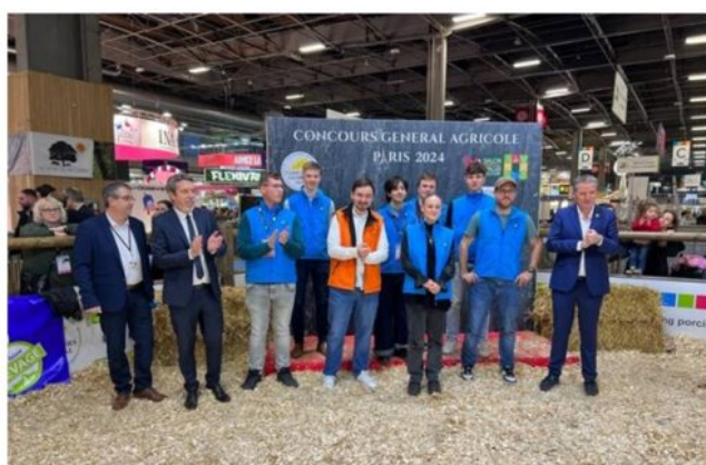
Remise des prix - lauréats CJPV/CJAJ européen

Remise des prix sur le Ring Porcin ( vidéo à visionner à partir de la minute 9'04 )