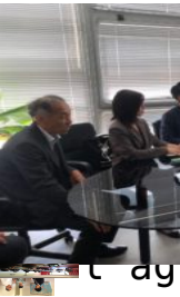
Photo de tête d'article, – Sagae, Province de YAMAGATA