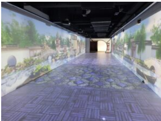
Couloir interactif pour se plonger dans l'art des jardins à la chinoise au SPIA

Les visioconférences du premier trimestre de cette année scolaire 2023-2024 ont permis de préciser les actions de coopération en se focalisant sur le thème du Jardin et sur l'Aménagement paysager. Plusieurs actions ont été évoquées mais il a fallu choisir pour ne pas se disperser ! Un cours en ligne sur les jardins classiques chinois, dispensé en anglais, a été mis à disposition des enseignants et étudiants de BTSA Aménagement Paysager.