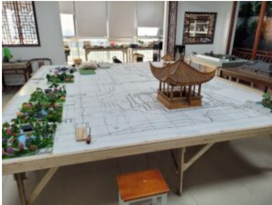
Salle de TP du SPIA

directeur des Relations Internationales. Le SPIA, établissement de plus de 10 000 apprenants, propose 43 filières dont 29 dédiées à l'agriculture, l'horticulture et l'aménagement paysager.