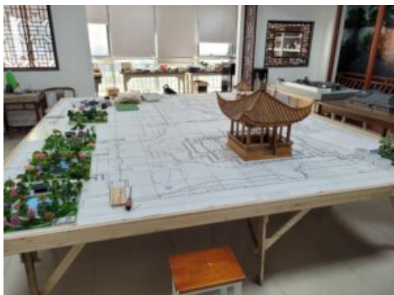
Salle de TP du SPIA

directeur des Relations Internationales. Le SPIA, établissement de plus de 10 000 apprenants, propose 43 filières dont 29 dédiées à l'agriculture, l'horticulture et l'aménagement paysager.