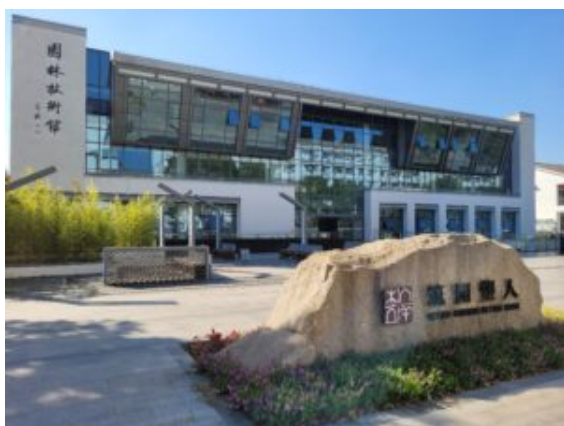
Bâtiment dédié aux formations en Aménagements Paysagers du SPIA

Le chantier de création de jardin a été l'opportunité de travailler avec 9 promotions d'aménagement paysager du Campus : lycéens, apprentis et adultes en formation continue et 10 enseignants-formateurs. Autant d'occasions d'échanger à la fois sur les techniques d'aménagement et bien sûr sur la culture générale.