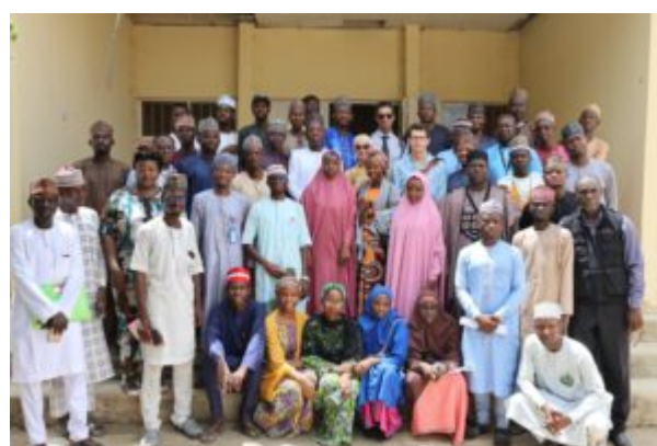
Audu Bako College of Agriculture (ABCOAD) Dambatta, État de Kano