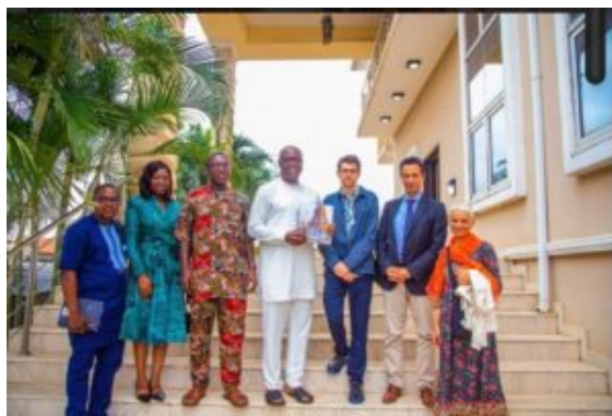
L'équipe de WATEA aux côtés

fs , en pa rt en ar ia t av ec l' en se ig ne nt ag ri co le fr an ça is .