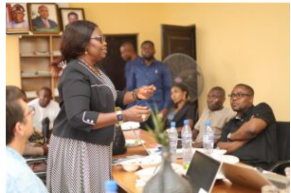
Enugu State College of Agriculture and agro-entrepreneurship (ESPOLY), État d'Enugu