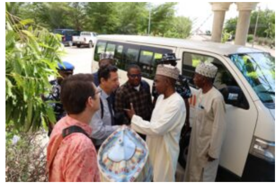
École polytechnique Binyaminu Usman (BUPOLY) Hadejia, État de Jigawa